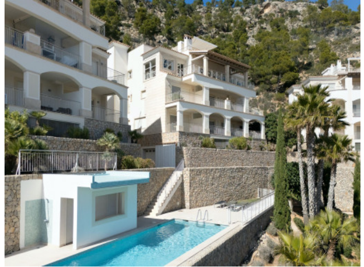
Zona de piscina