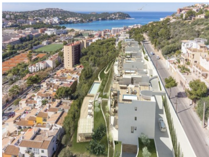
Vistas impresionantes al mar

Toda la información como mejor se puede saber, salvo por error durante el periodo de venta. Sirva este documento como un informe previo, las bases legales solo serán válidas a través de un contrato de compra acordado ante Notario.