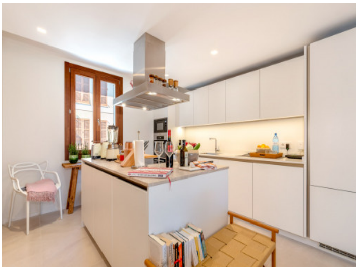
Cocina completamente equipada