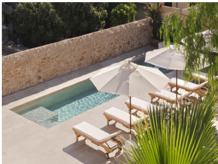
Maravillosa zona de piscina