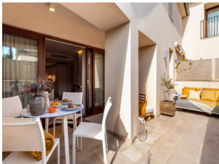
Terraza parcialmente cubierta

Toda la información como mejor se puede saber, salvo por error durante el periodo de venta. Sirva este documento como un informe previo, las bases legales solo serán válidas a través de un contrato de compra acordado ante Notario.