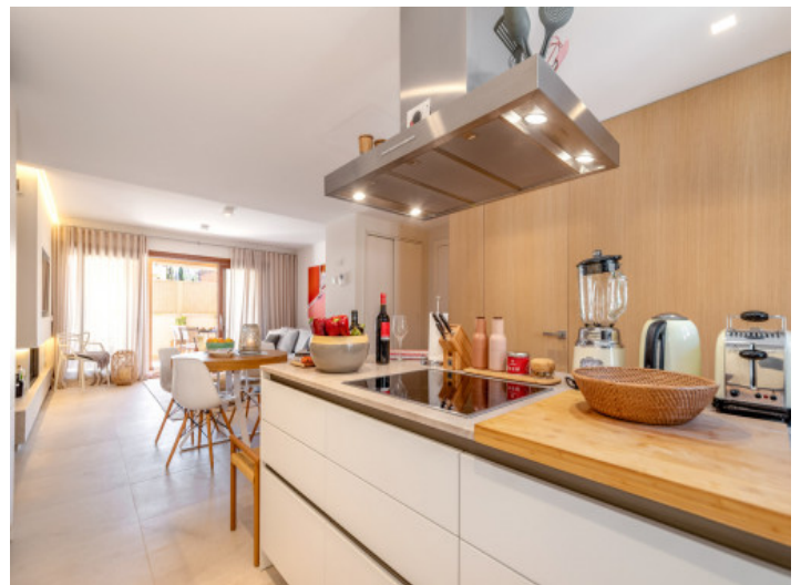
Cocina con isla

Toda la información como mejor se puede saber, salvo por error durante el periodo de venta. Sirva este documento como un informe previo, las bases legales solo serán válidas a través de un contrato de compra acordado ante Notario.