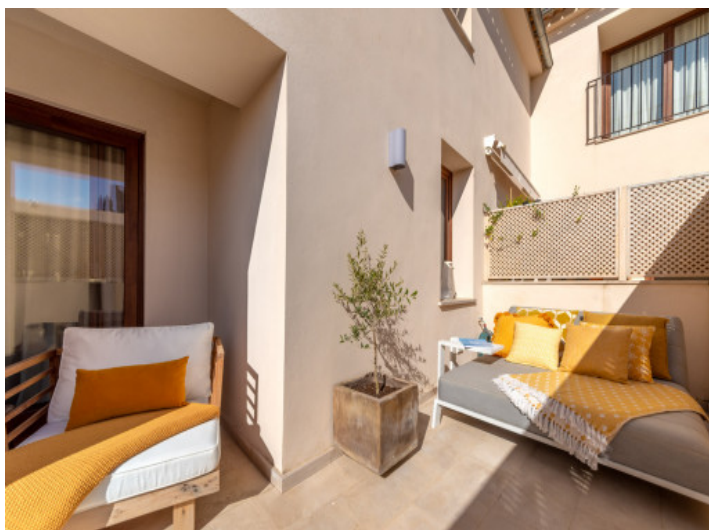
Terraza soleada con asientos