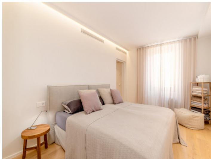
Uno de 3 dormitorios