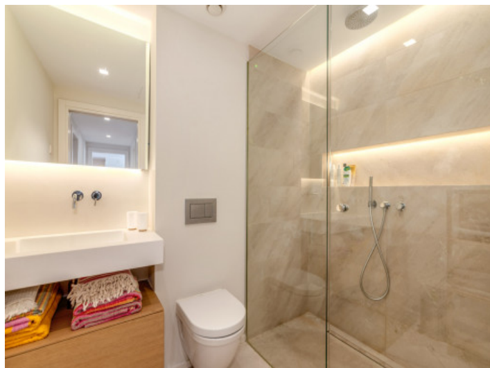
Uno de 2 cuartos de baño