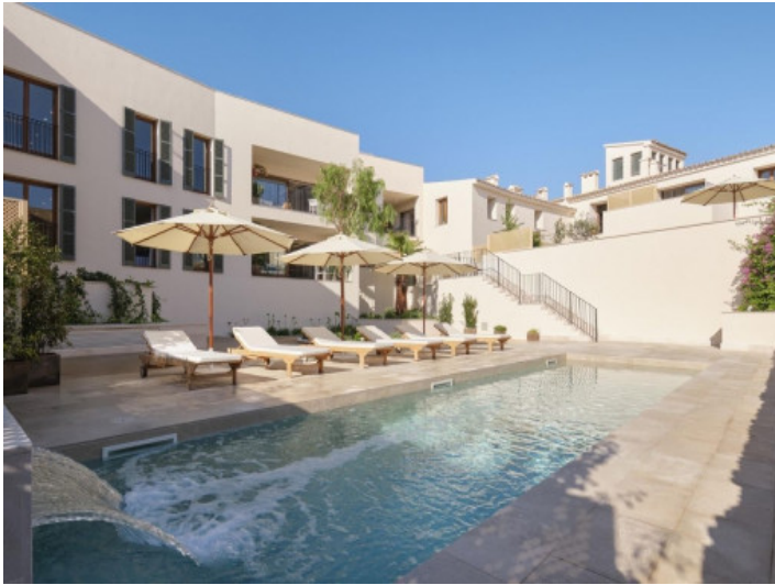
Maravillosa zona de piscina