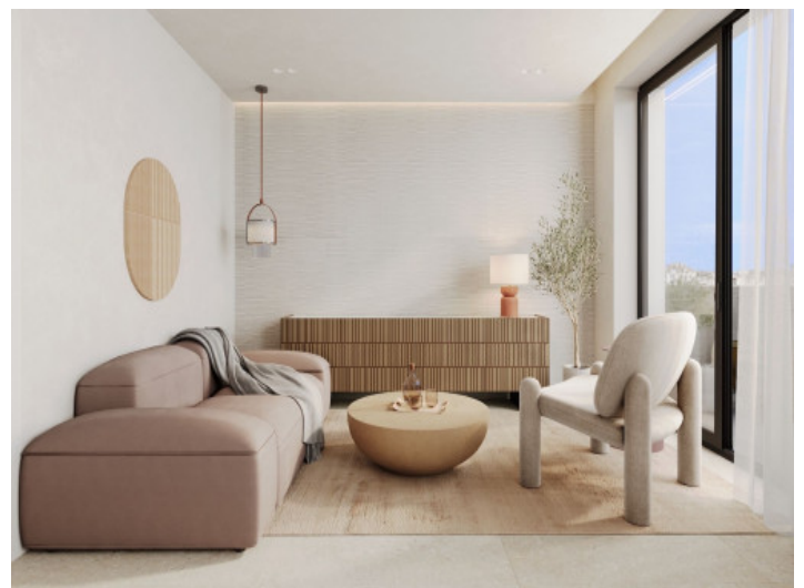
Luminosa sala de estar

Toda la información como mejor se puede saber, salvo por error durante el periodo de venta. Sirva este documento como un informe previo, las bases legales solo serán válidas a través de un contrato de compra acordado ante Notario.