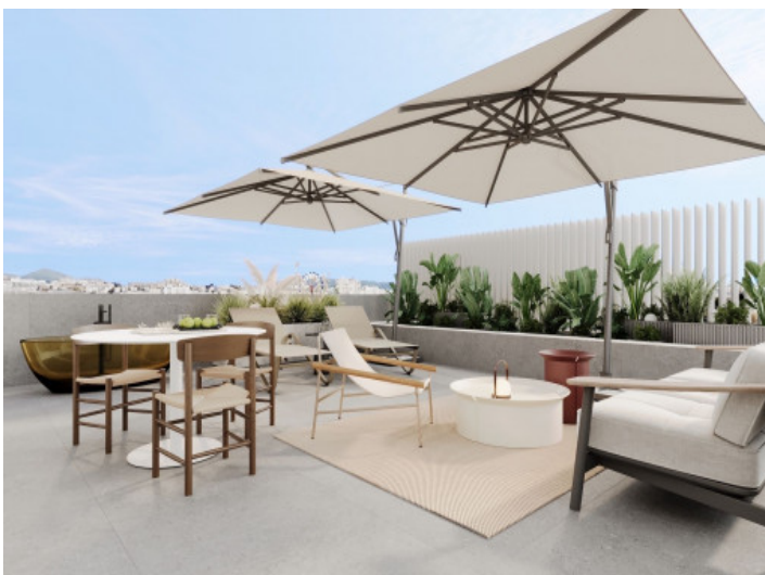
Azotea equipada con muebles