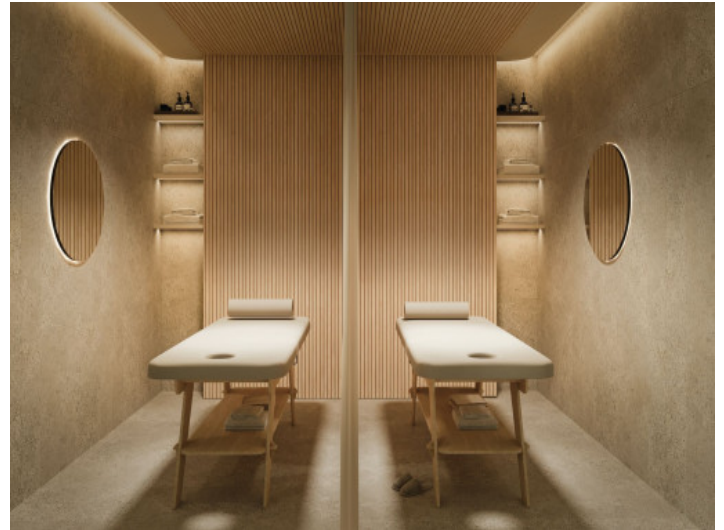
Sala de masajes