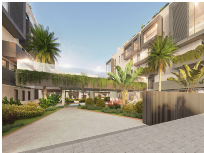
Acceso al complejo