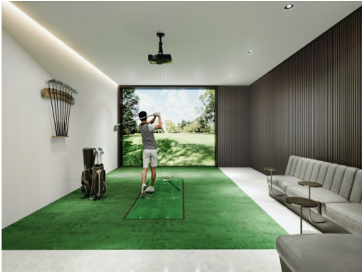
Simulador de golf