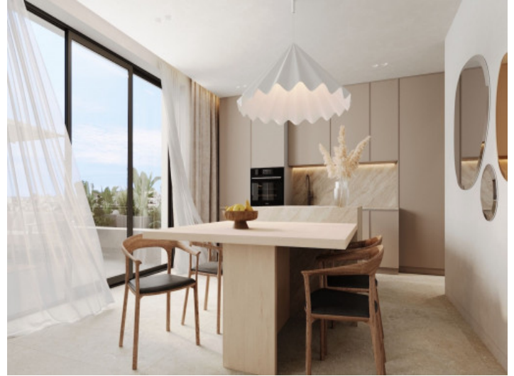
Cocina y comedor