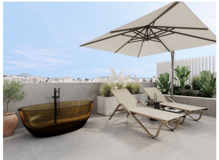
Terraza privada en la azotea