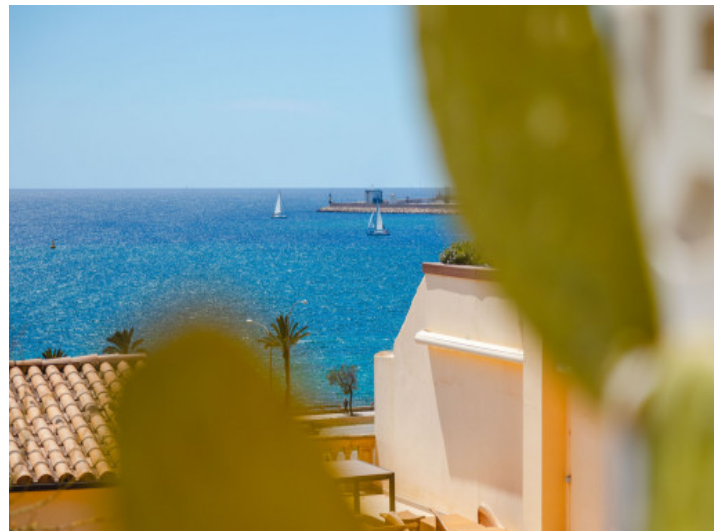
Vistas al mar