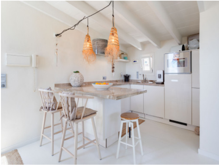
Cocina y comedor