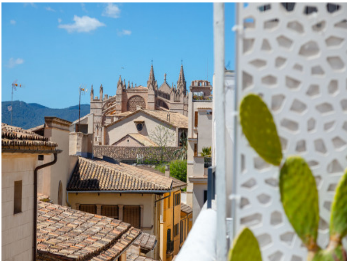
Vistas a la cathedral