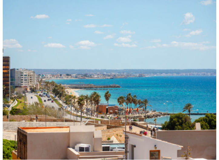
Vistas al mar