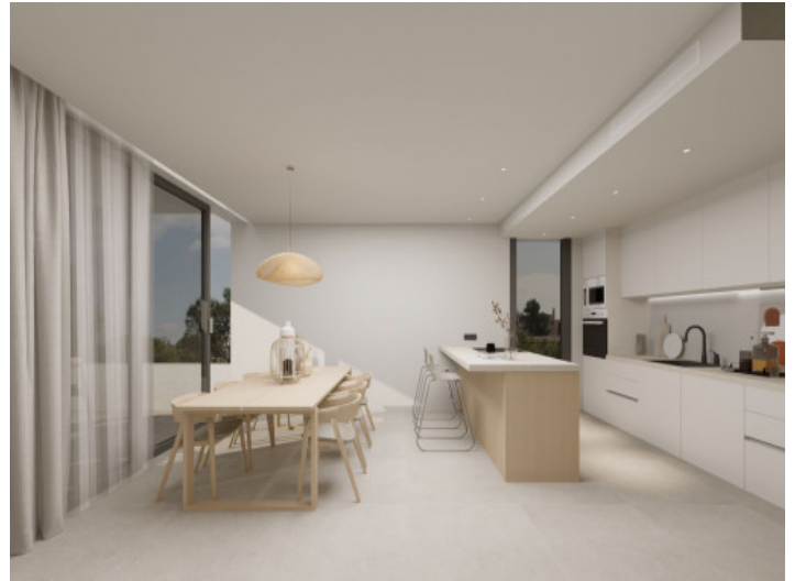
Salón y comedor