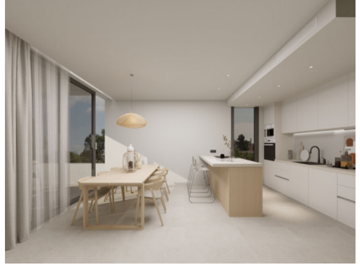
Cocina y comedor