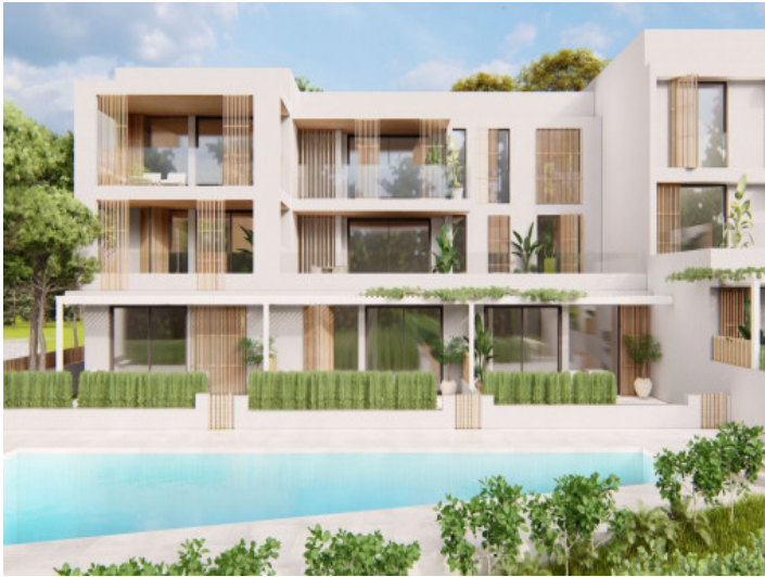
Vista a la piscina y fachada