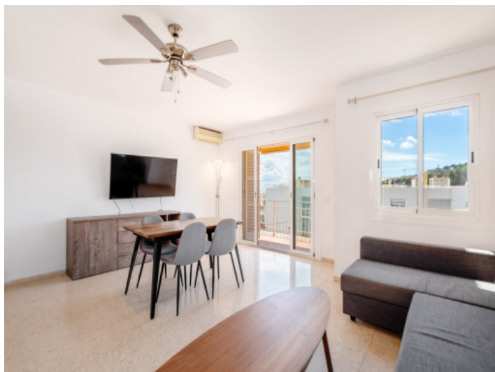
Salón y comedor