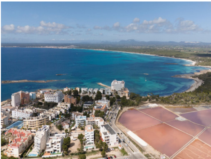
Colonia Sant Jordi