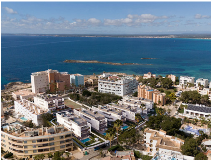
Colonia Sant Jordi