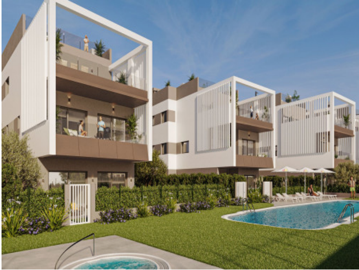
Fachada y piscina