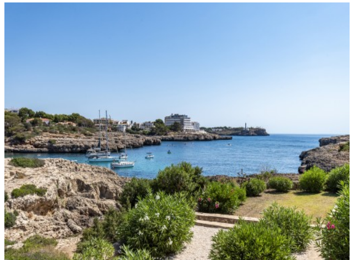
Acceso al mar