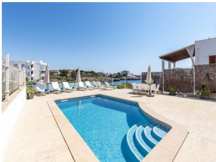
Piscina y terraza