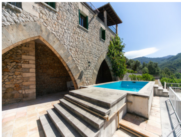
Vista exterior y piscina

Toda la información como mejor se puede saber, salvo por error durante el periodo de venta. Sirva este documento como un informe previo, las bases legales solo serán válidas a través de un contrato de compra acordado ante Notario.