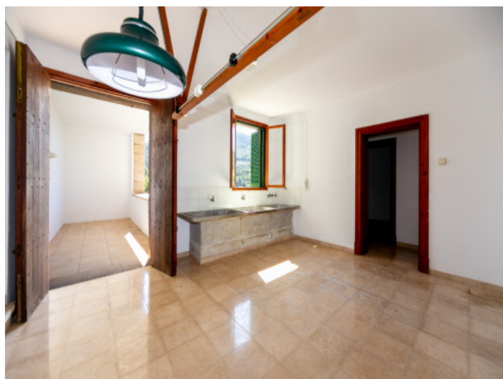
Cuarto de servicio antiguo