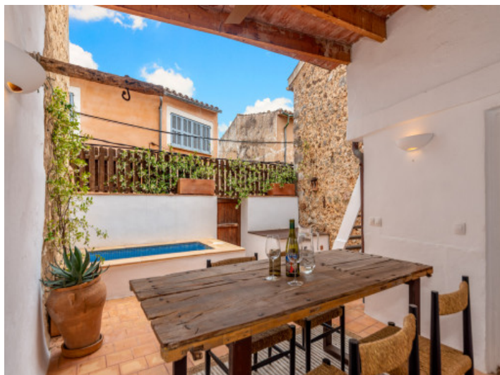
Terraza con piscina