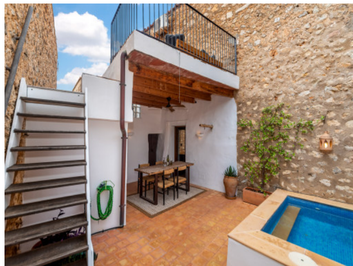
Terraza con piscina