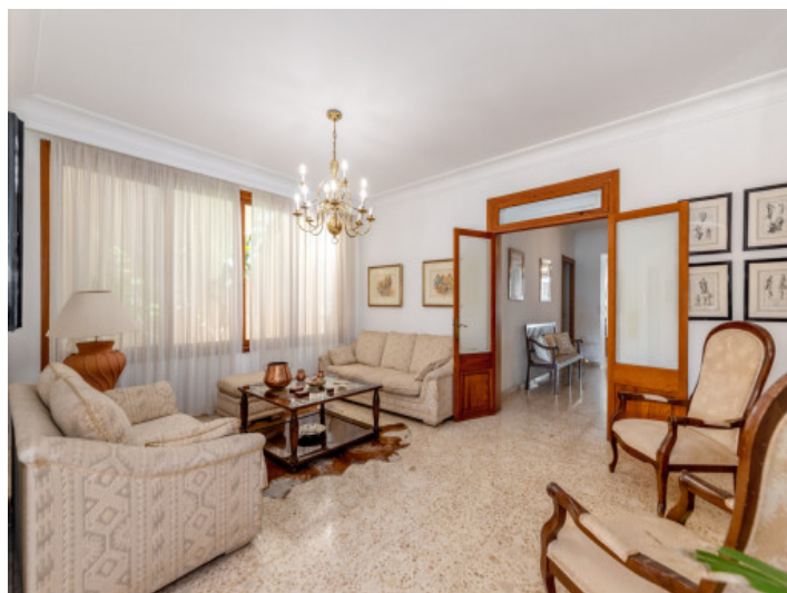
Zona de estar separada

Toda la información como mejor se puede saber, salvo por error durante el periodo de venta. Sirva este documento como un informe previo, las bases legales solo serán válidas a través de un contrato de compra acordado ante Notario.