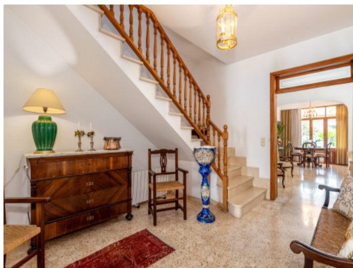
Pasillo y zona de estar