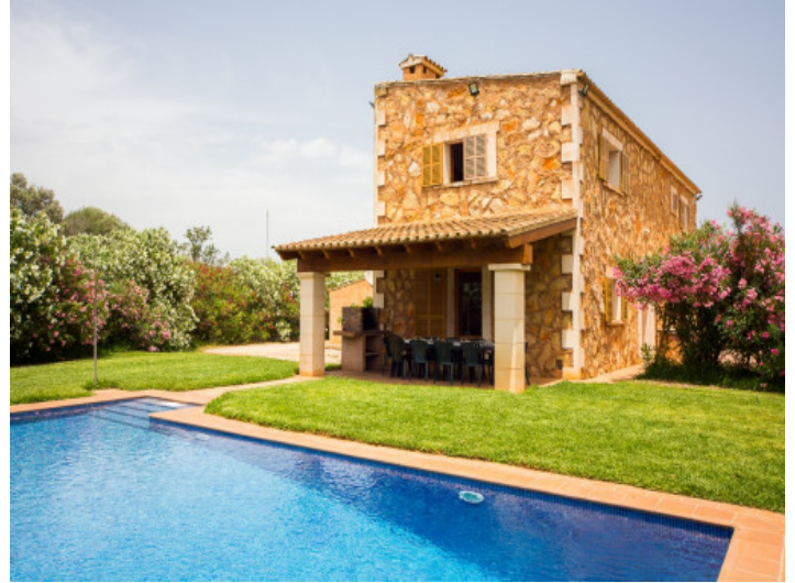
Piscina bien cuidada