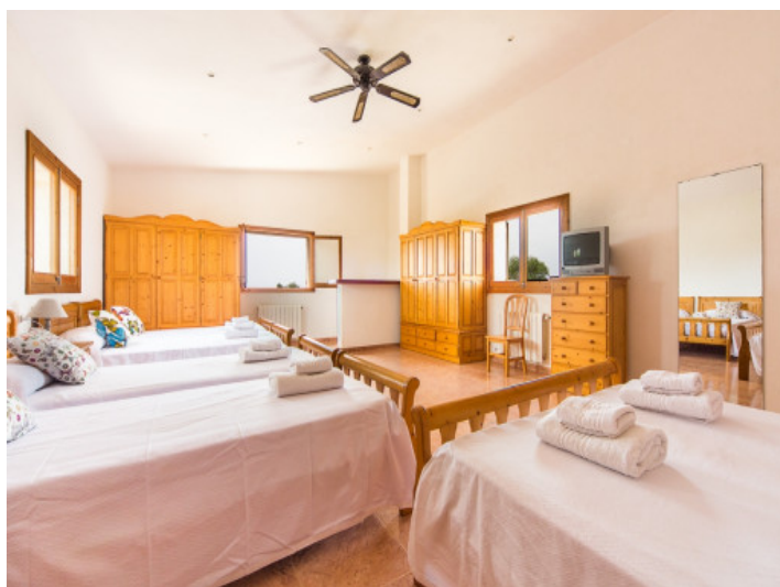
Gran dormitorio inundado de luz