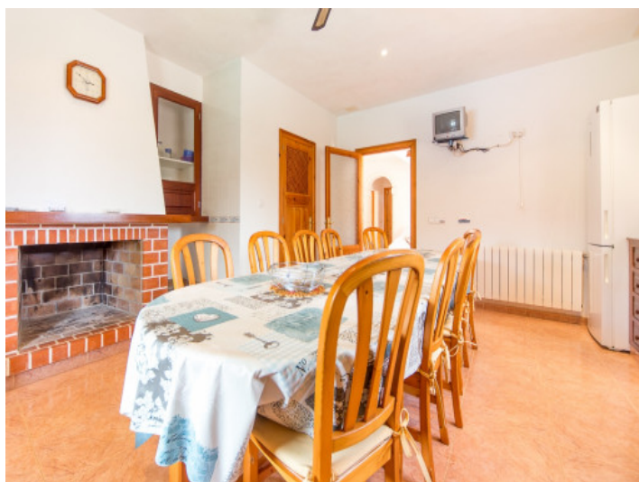
Comedor acogedor con chimenea