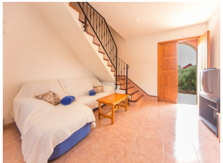
Área de estar luminosa

Toda la información como mejor se puede saber, salvo por error durante el periodo de venta. Sirva este documento como un informe previo, las bases legales solo serán válidas a través de un contrato de compra acordado ante Notario.