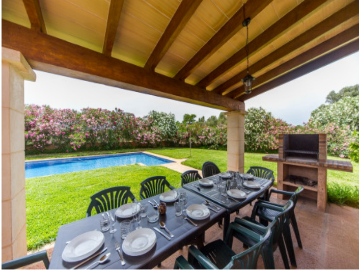
Comedor en la terraza cubierta