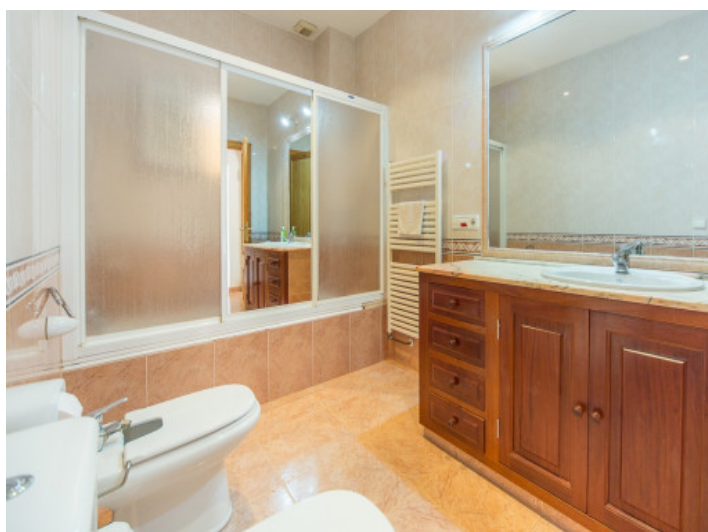
Uno de los 3 baños