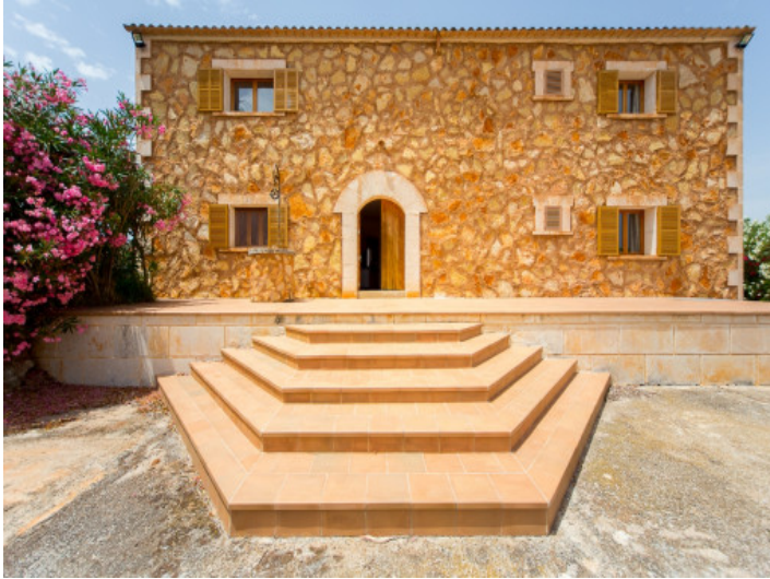
Entrada de la propiedad maravillosa