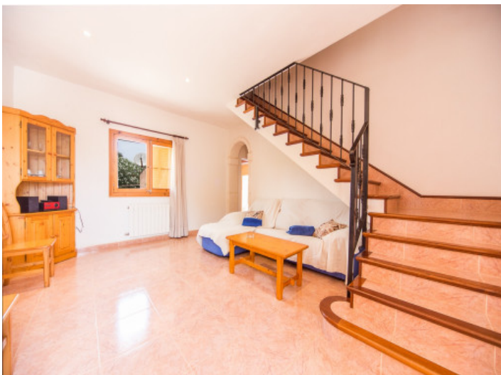
Zona de estar con mucho potencial