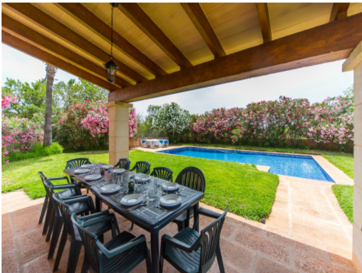
Terraza cubierta fantástica