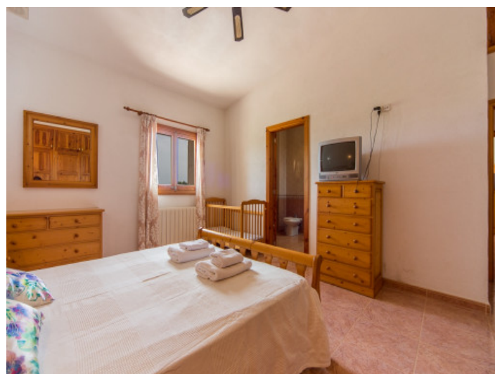
Dormitorio doble rústico

Toda la información como mejor se puede saber, salvo por error durante el periodo de venta. Sirva este documento como un informe previo, las bases legales solo serán válidas a través de un contrato de compra acordado ante Notario.