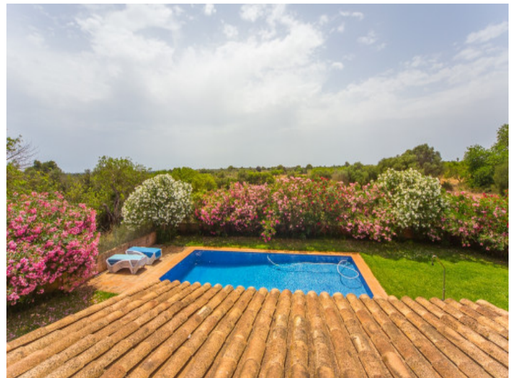
Vistas sobre la piscina y el jardín precioso