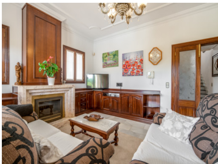
Área de estar con chimenea