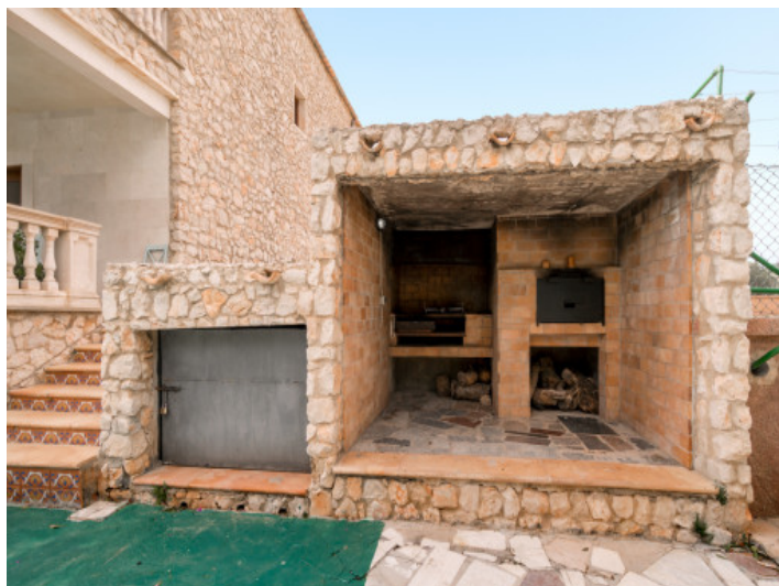
Zona de barbacoa en estilo mallorquín