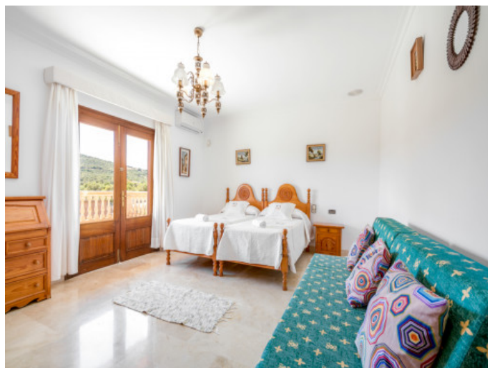
Dormitorio con acceso al balcón

Toda la información como mejor se puede saber, salvo por error durante el periodo de venta. Sirva este documento como un informe previo, las bases legales solo serán válidas a través de un contrato de compra acordado ante Notario.