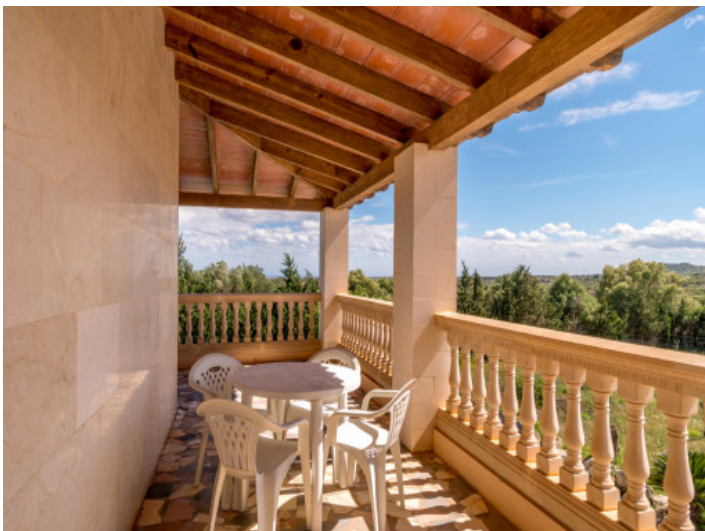
Balcón con vistas lejanas