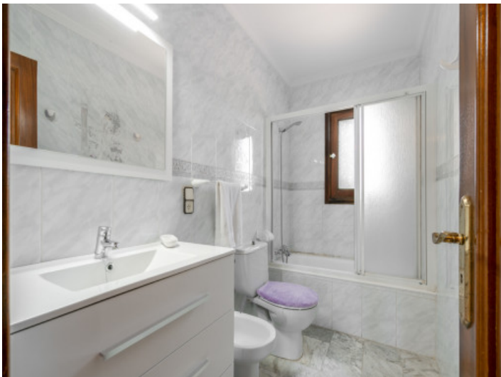
Uno de 4 baños