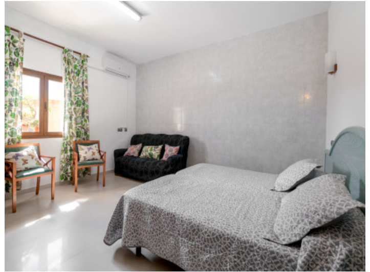
Dormitorio con entrada separada