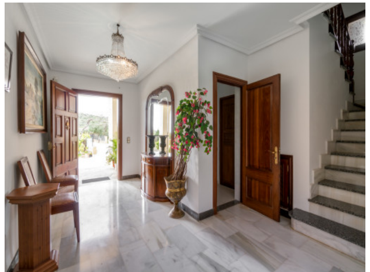
Área de entrada con acceso al piso superior