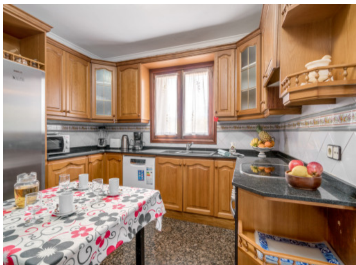
Cocina de madera con comedor