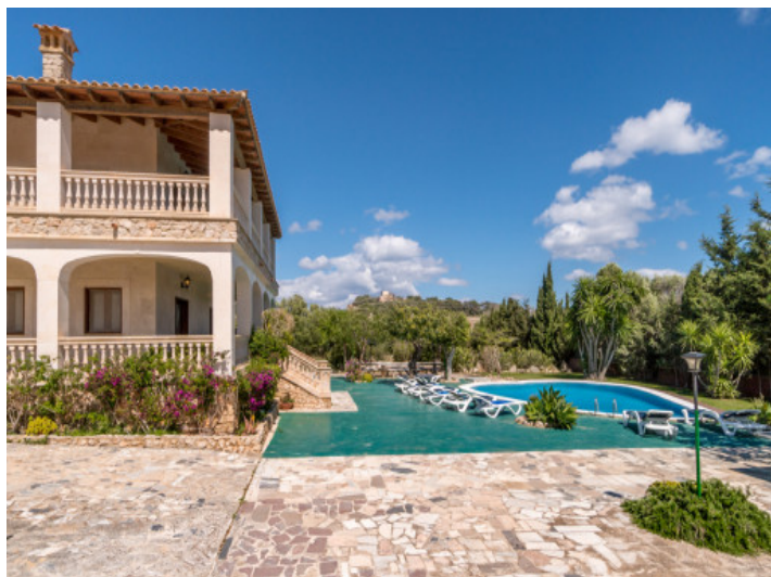
Amplia área de piscina muy privada