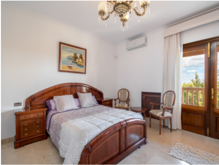
Uno de 5 dormitorios dobles