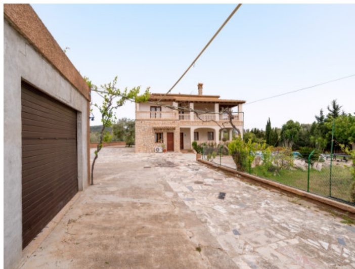
Acceso a la finca