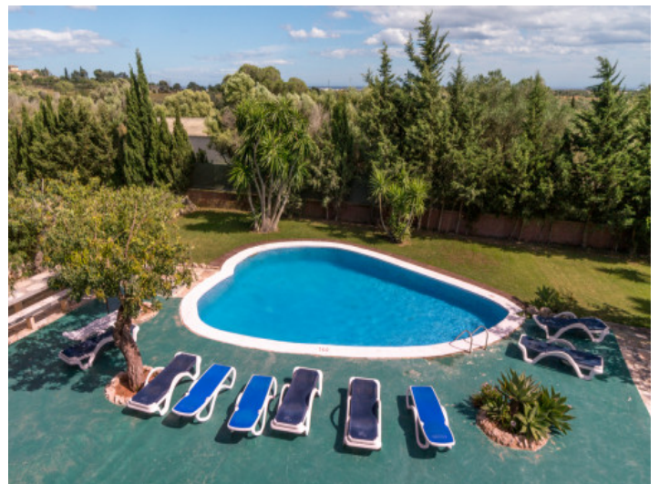
Vistas al jardín con piscina

Toda la información como mejor se puede saber, salvo por error durante el periodo de venta. Sirva este documento como un informe previo, las bases legales solo serán válidas a través de un contrato de compra acordado ante Notario.