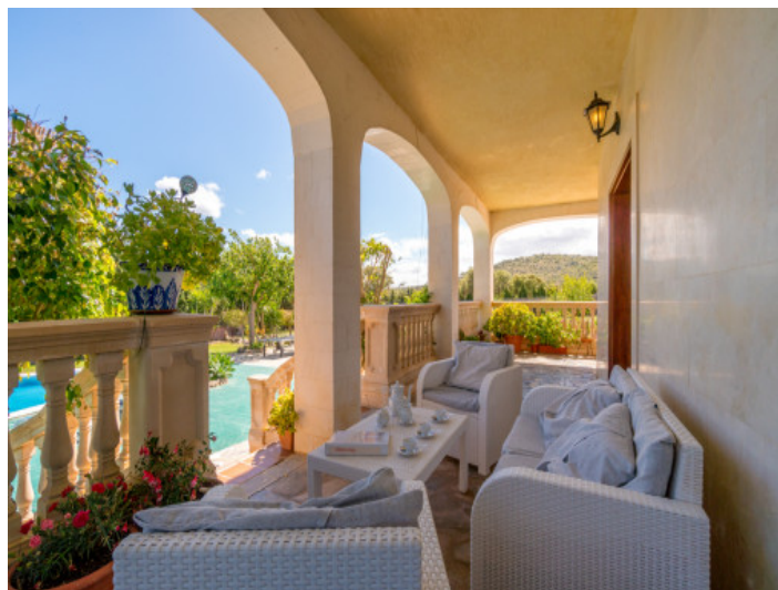
Hermosa terraza con acceso a la piscina