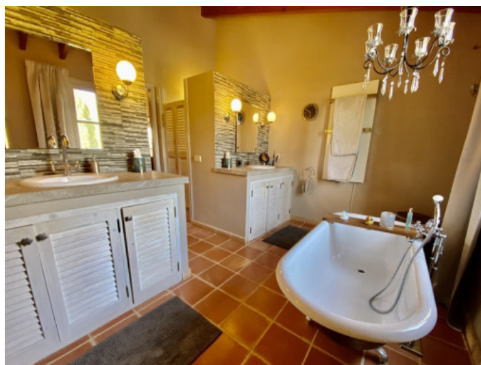
Baño con bañera