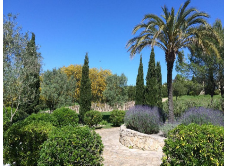
Vista al jardín