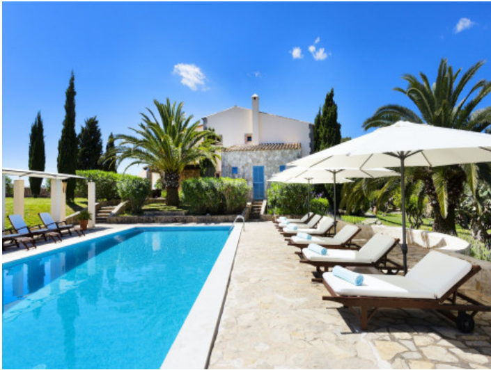
Piscina atractiva con tumbonas