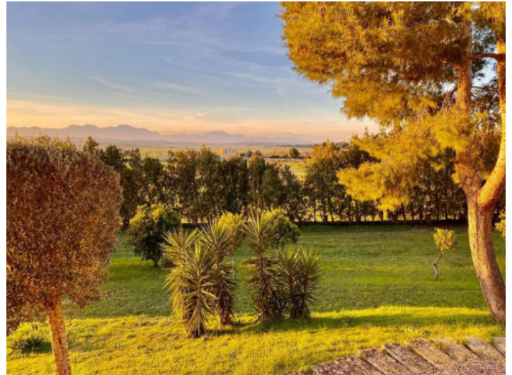
Vista idílica al paisaje

Toda la información como mejor se puede saber, salvo por error durante el periodo de venta. Sirva este documento como un informe previo, las bases legales solo serán válidas a través de un contrato de compra acordado ante Notario.