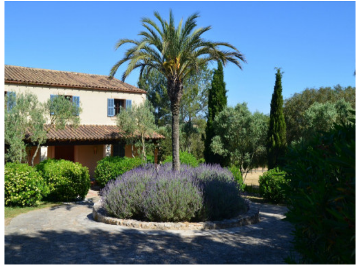
Vista exterior de la finca