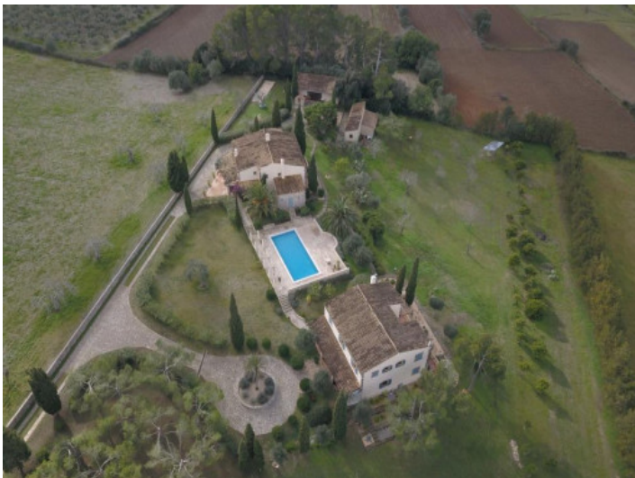
Finca a vista de pájaro