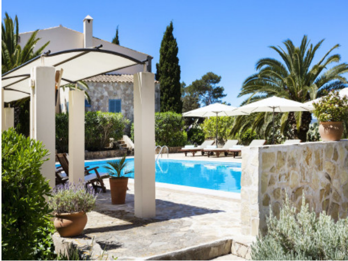
Vista alternativa a la piscina