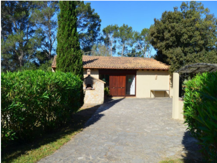
Vista al jardín