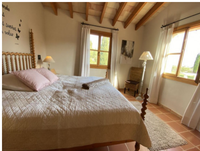
Uno de 11 dormitorios