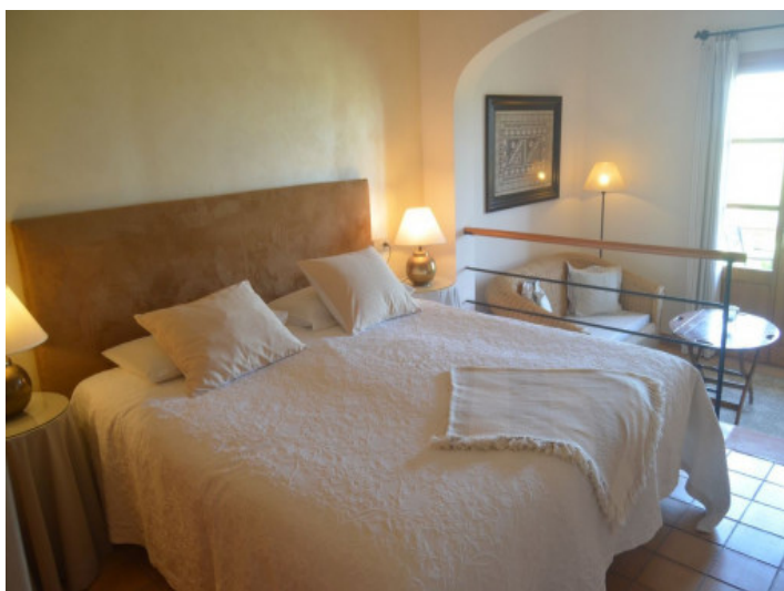
Uno de 11 dormitorios