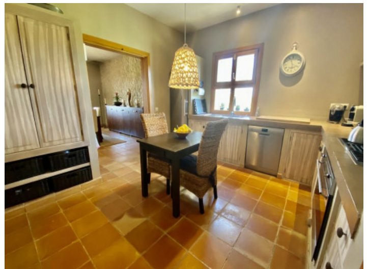
Vista a la cocina con comedor

Toda la información como mejor se puede saber, salvo por error durante el periodo de venta. Sirva este documento como un informe previo, las bases legales solo serán válidas a través de un contrato de compra acordado ante Notario.