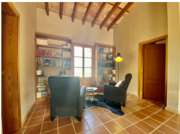
Zona de estar