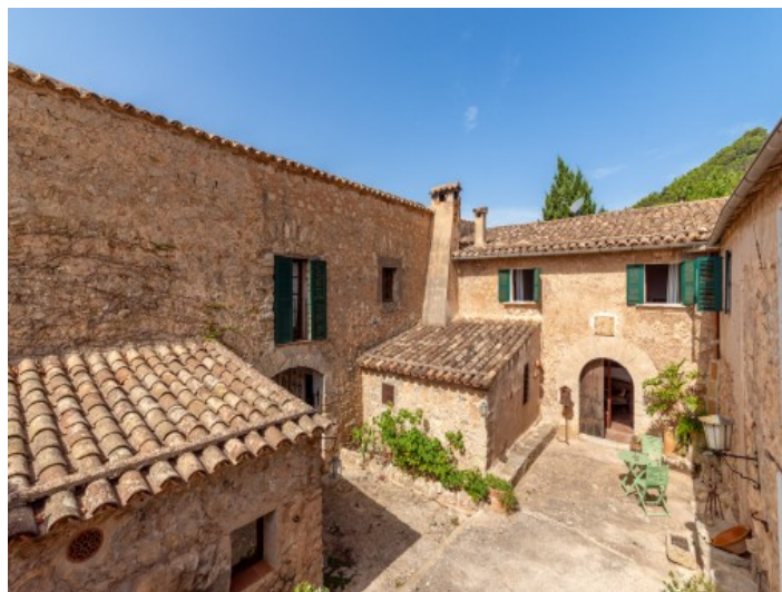
Finca y patio