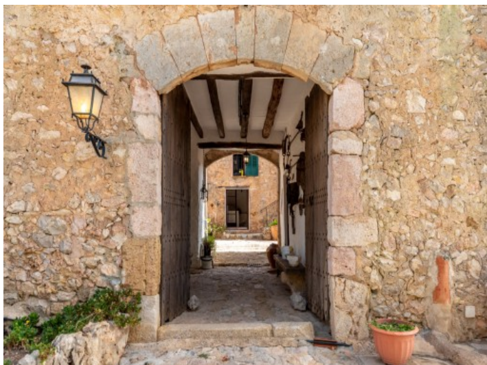
Entrada al patio