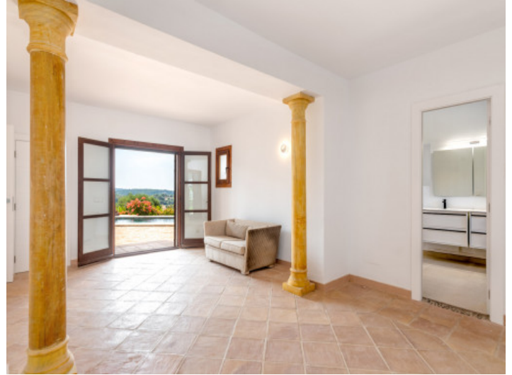
Uno de 6 dormitorios