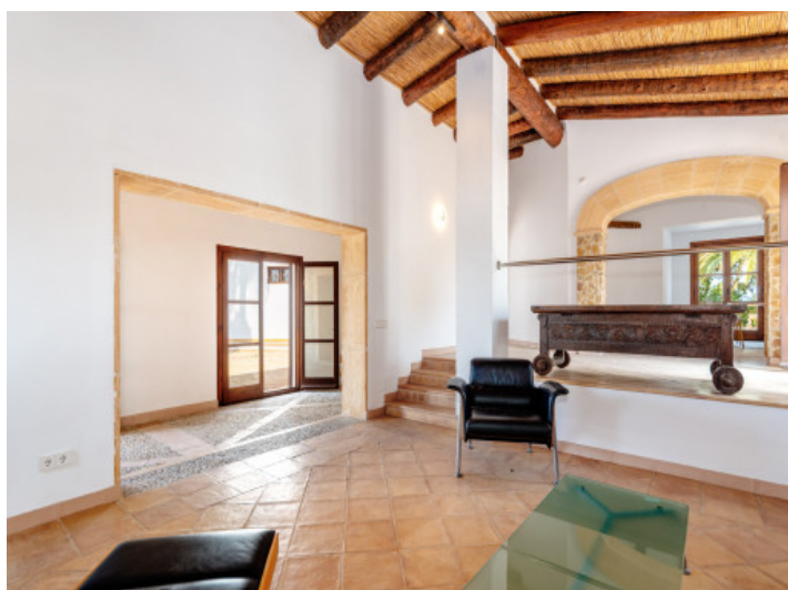
Salón con chimenea