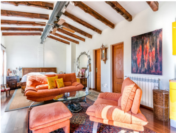
Apartamento de huéspedes inundado de luz