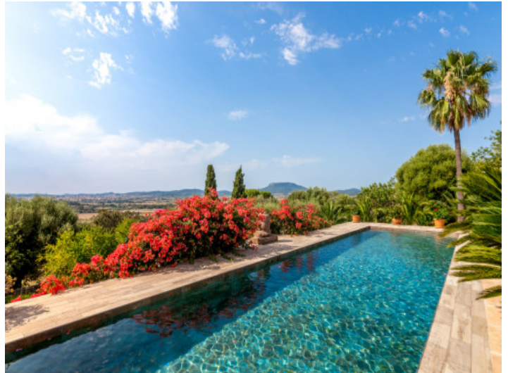
Piscina con vista