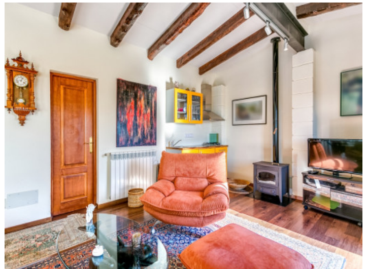
Chimenea y cocina pequeña en el apartamento de huéspedes