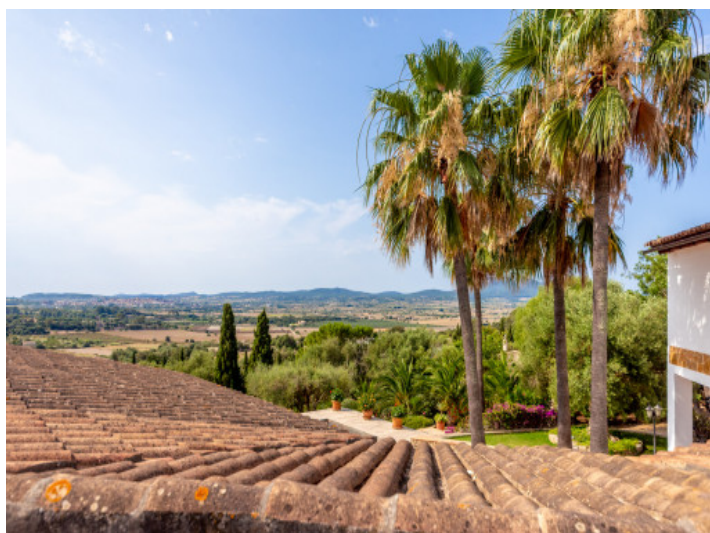
Vista al campo