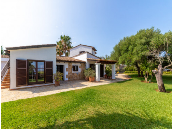
Vista exterior y jardín