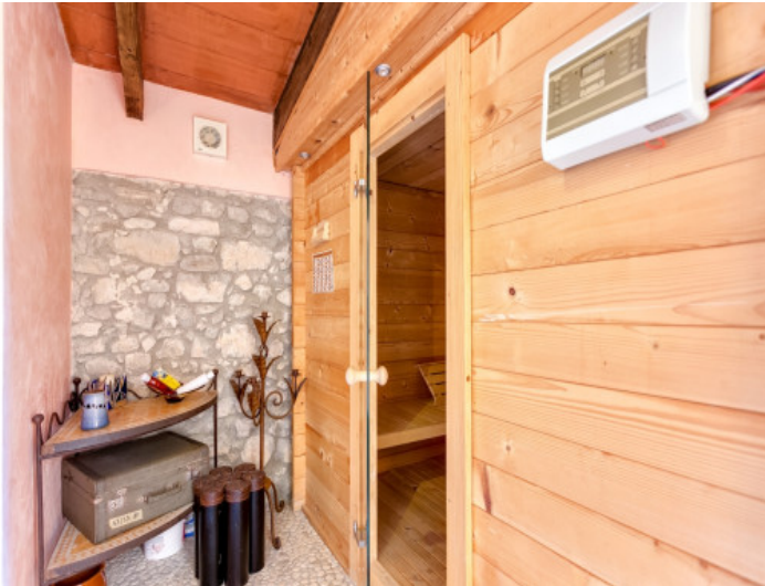
Spa con sauna