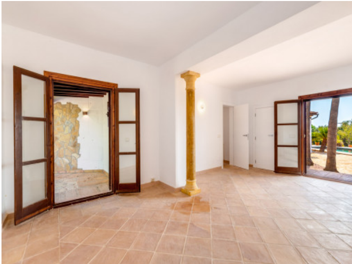
Uno de 6 dormitorios