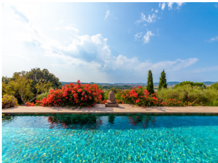
Piscina con una vista