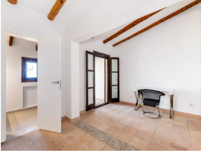
Uno de 6 dormitorios