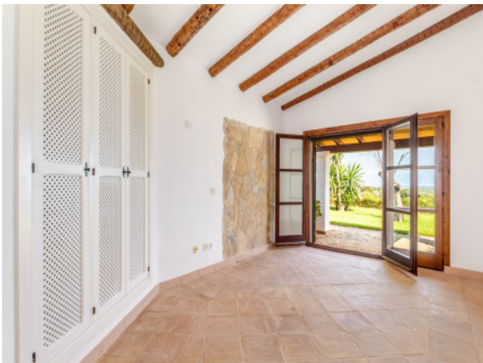
Uno de 6 dormitorios