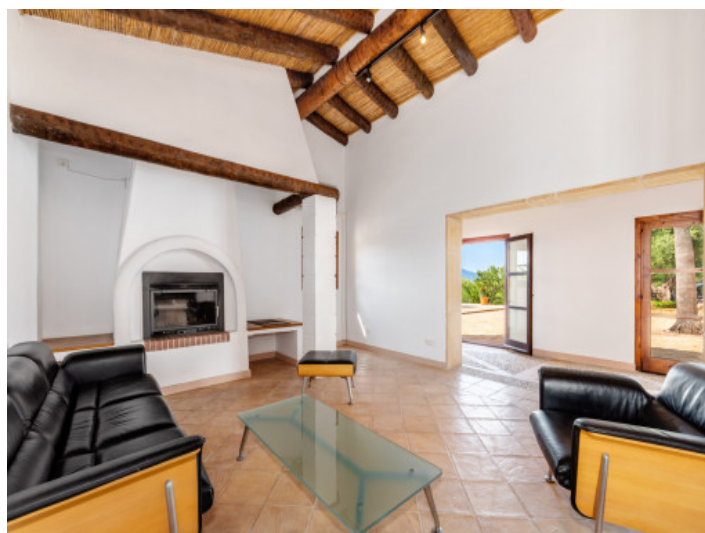
Salón con chimenea