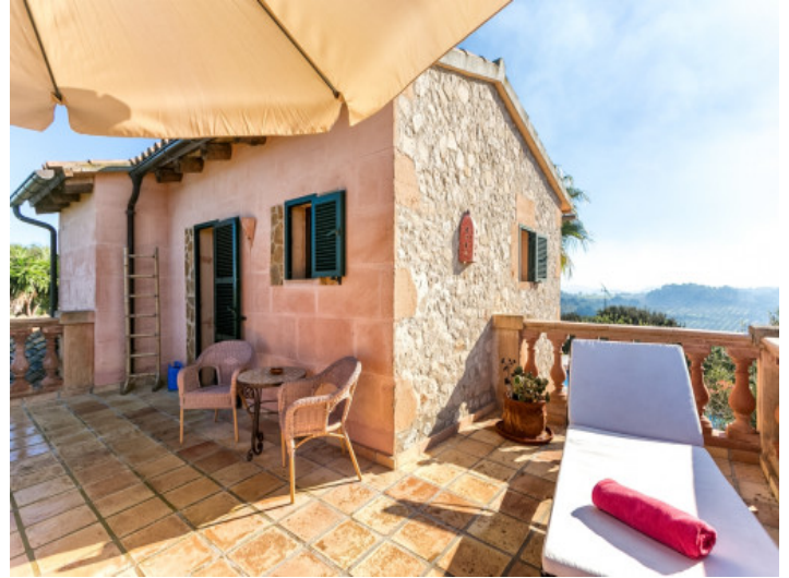
Casa de huéspedes