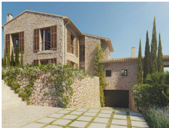
Vista exterior y garage