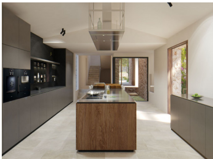
Cocina con isla central