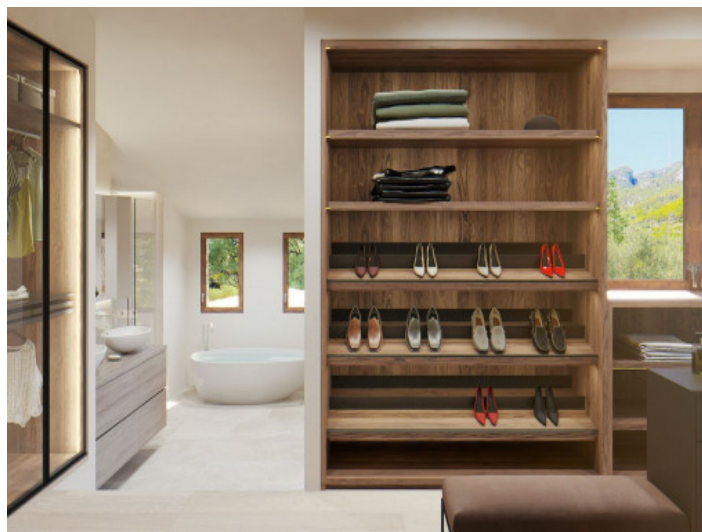
Vestidor y baño en suite