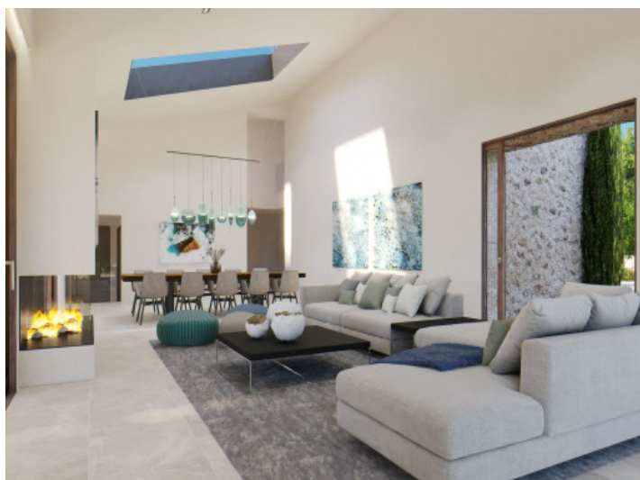
Salón con chimenea