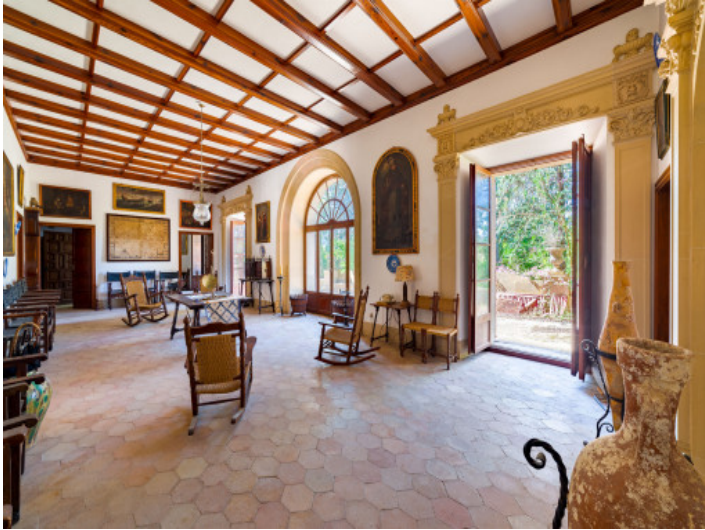
Gran propiedad en Establiments