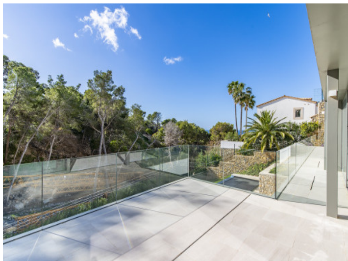
Terraza con vistas al mar