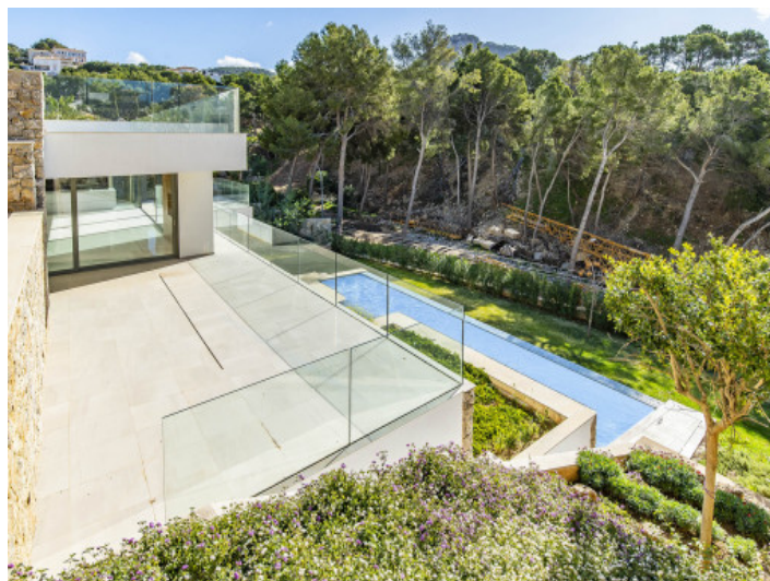
Terraza y piscina