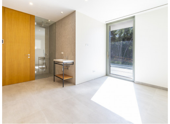
Dormitorio y baño