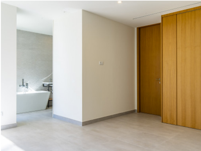
Dormitorio y baño