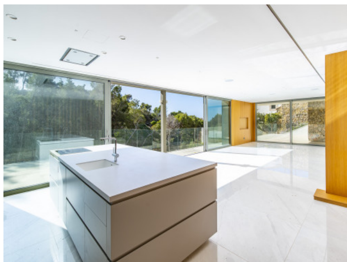
Salón y cocina