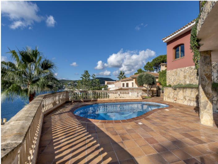
Terraza y piscina