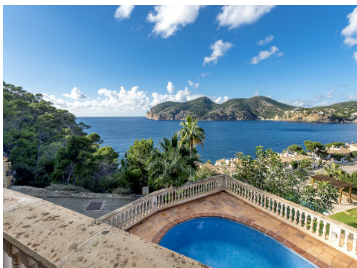
Impresionantes vistas al mar de la villa en Camp de Mar