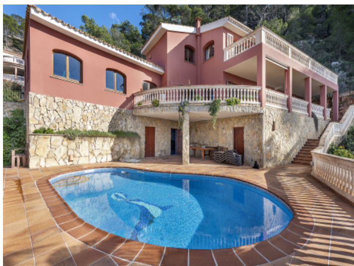
Vista exterior de la villa en Camp de Mar