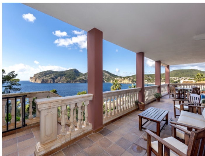
Balcón con una vista