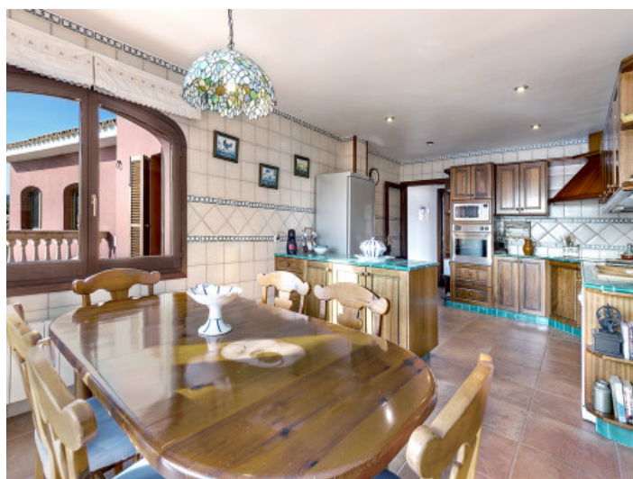
Cocina con comedor

Toda la información como mejor se puede saber, salvo por error durante el periodo de venta. Sirva este documento como un informe previo, las bases legales solo serán válidas a través de un contrato de compra acordado ante Notario.