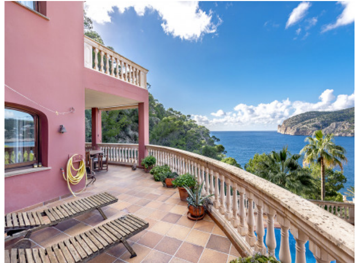
Terraza con tumbonas