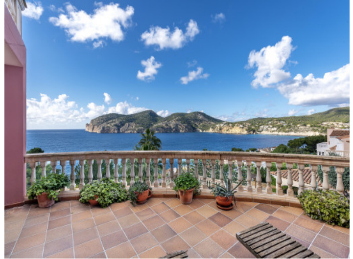
Balcón con una vista