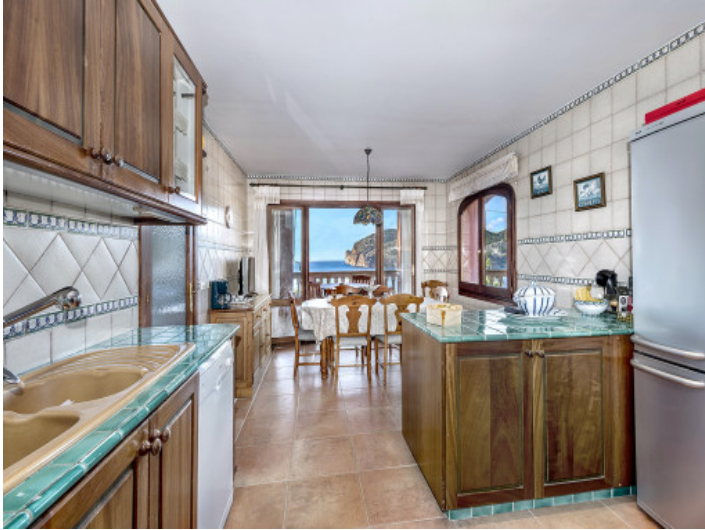
Cocina con comedor