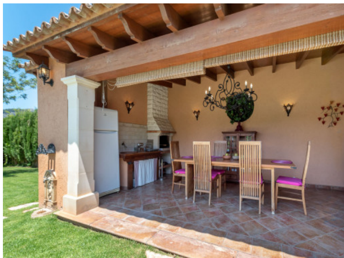
Área de barbacoa