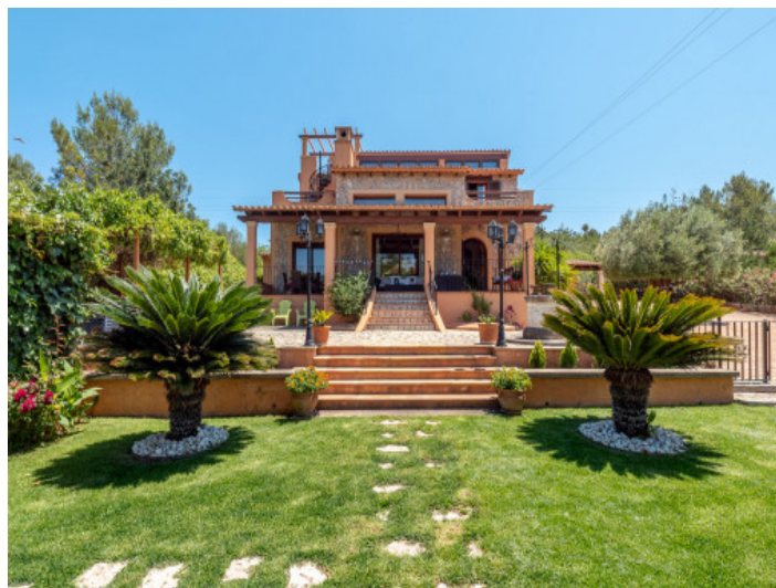
Vista exterior y jardín