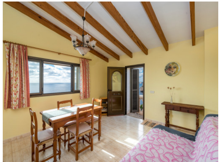
Otro comedor con vigas de madera