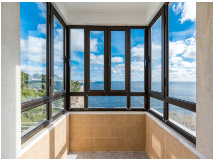
Hermosas vistas panorámicas