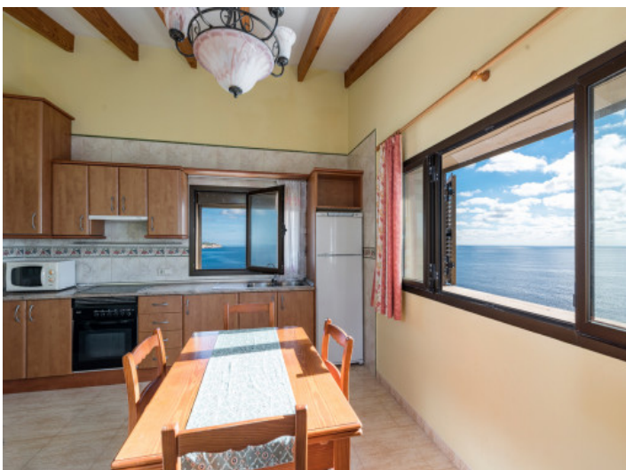
Comedor y cocina con ventanas panorámicas