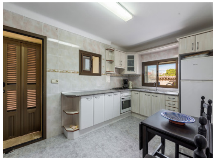
Segunda cocina de la propiedad

Toda la información como mejor se puede saber, salvo por error durante el periodo de venta. Sirva este documento como un informe previo, las bases legales solo serán válidas a través de un contrato de compra acordado ante Notario.