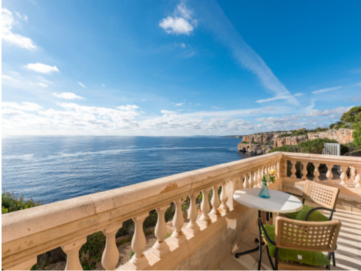
Terraza con vistas al mar