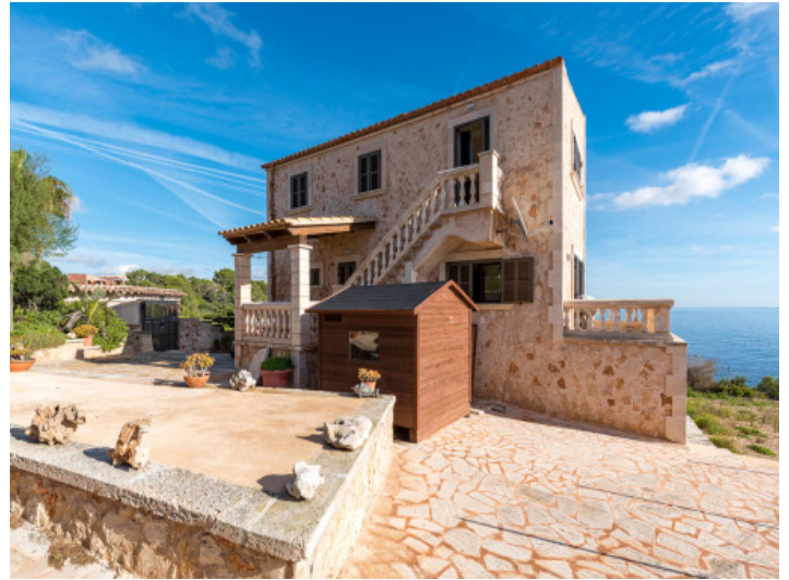
Vista frontal de la villa con fachada de piedra