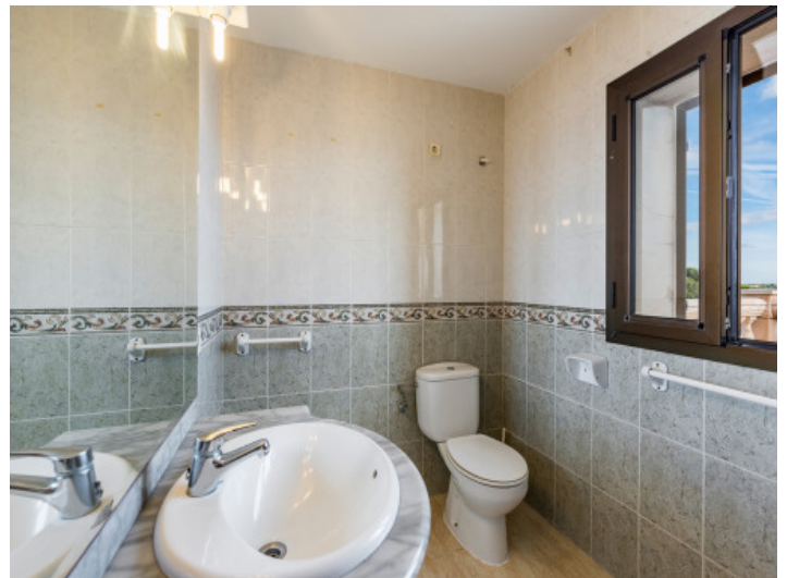
Uno de 3 baños