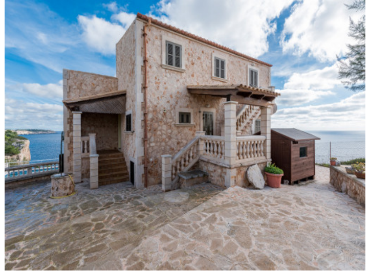
Vista exterior de la villa