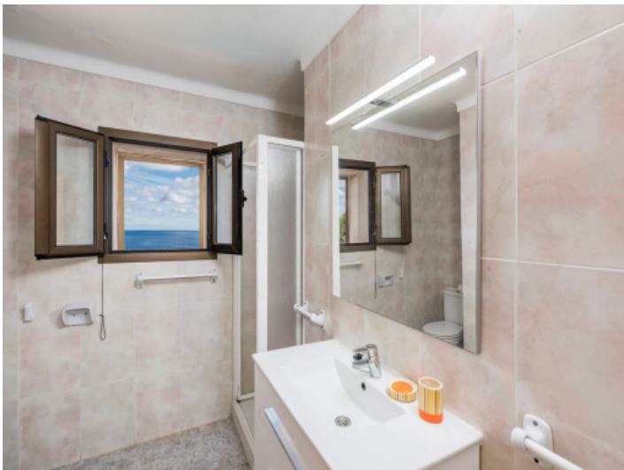
Uno de 3 baños