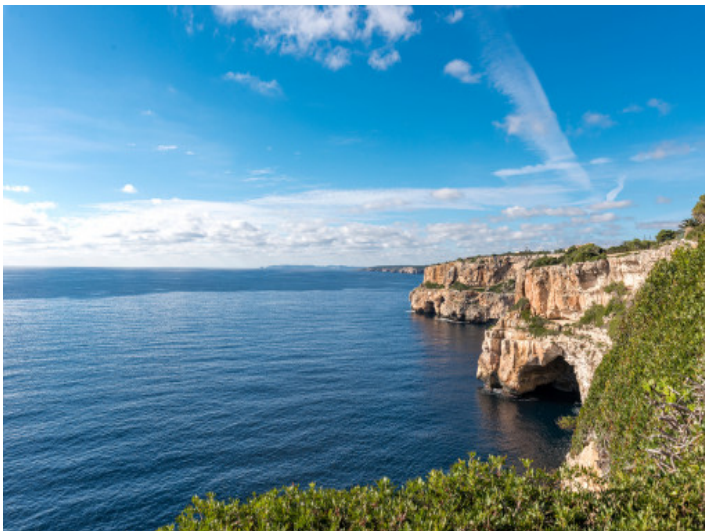
Vistas al mar y los acantilados