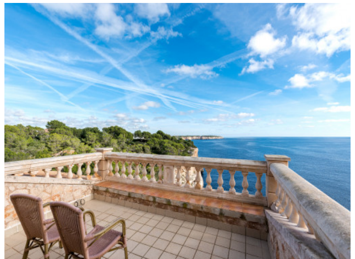
Magnífica azotea con vistas al mar

Toda la información como mejor se puede saber, salvo por error durante el periodo de venta. Sirva este documento como un informe previo, las bases legales solo serán válidas a través de un contrato de compra acordado ante Notario.