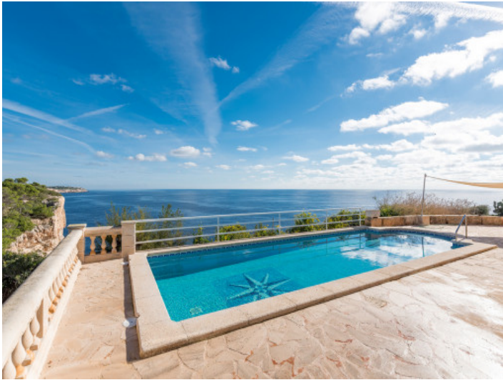
Fantástica área de piscina al lado del mar