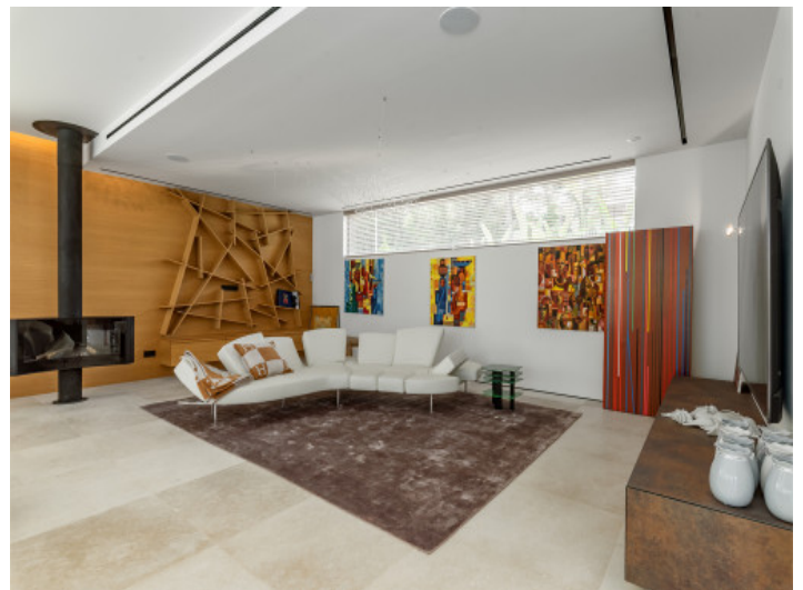
Salón con chimenea

Toda la información como mejor se puede saber, salvo por error durante el periodo de venta. Sirva este documento como un informe previo, las bases legales solo serán válidas a través de un contrato de compra acordado ante Notario.