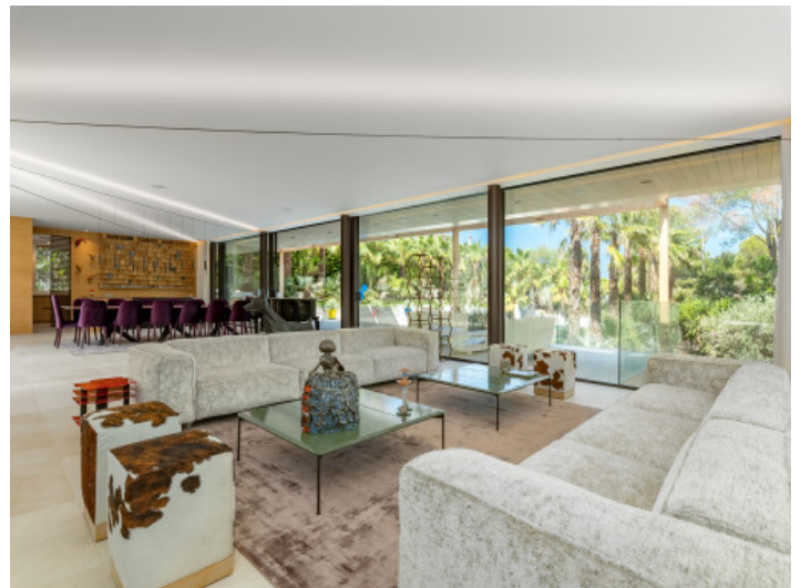
Salón y comedor