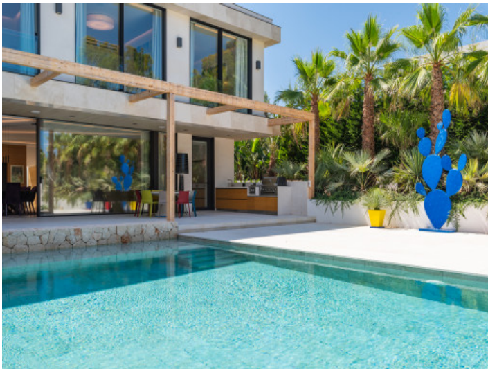
Área de la piscina