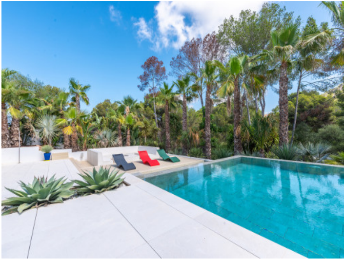
Área de la piscina