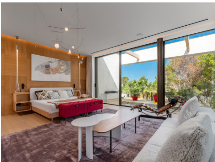
Dormitorio con sofa