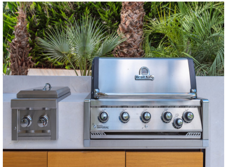
Área de barbacoa