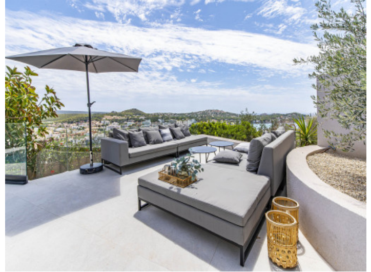
Área de estar