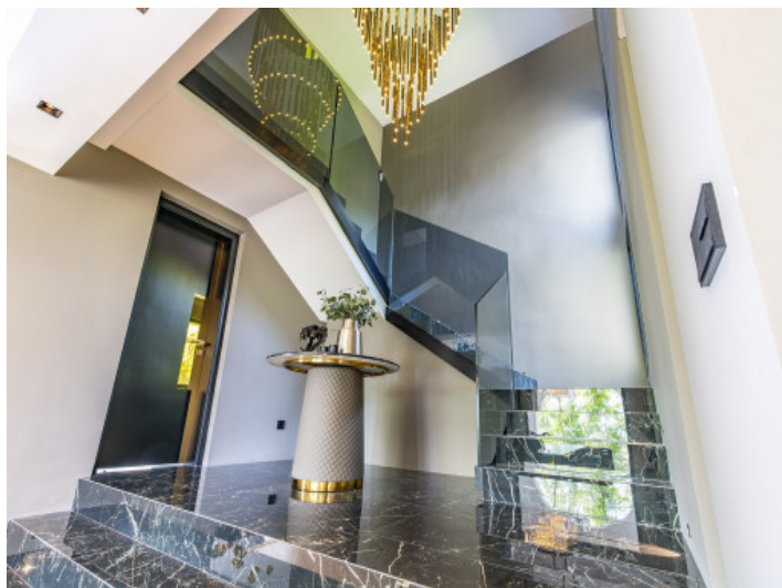
Entrada de la villa