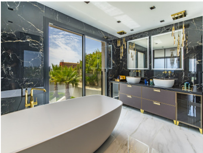
Baño con bañera