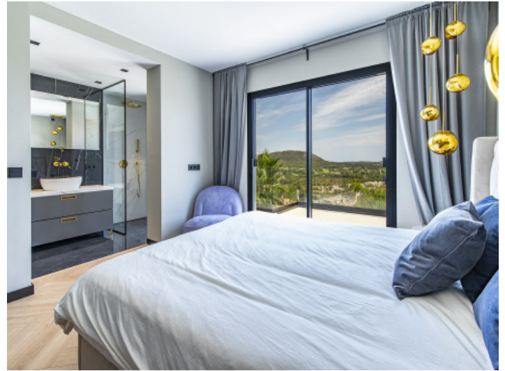
Dormitorio con baño en suite