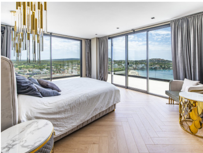
Dormitorio con ventanas grandes