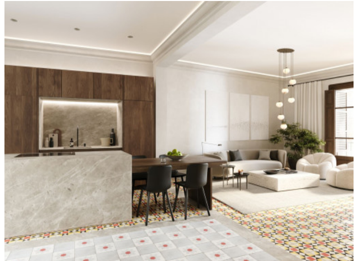
Ejemplo de la vivienda