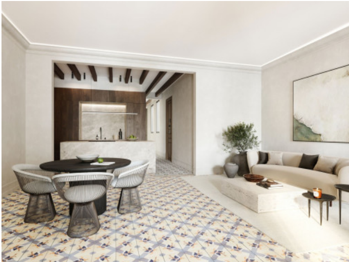
Ejemplo de la vivienda