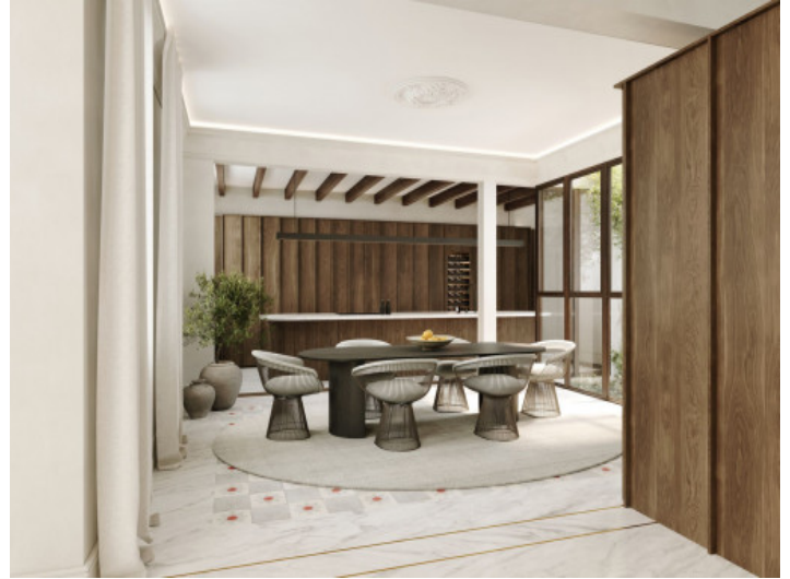
Ejemplo de la vivienda