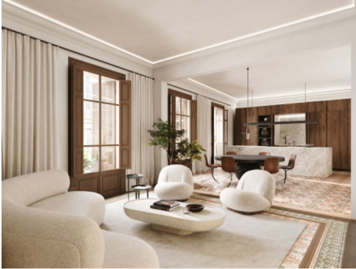
Ejemplo de la vivienda