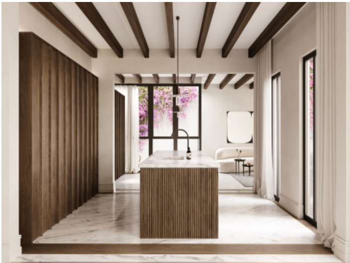
Ejemplo de la vivienda