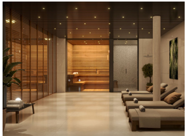
Fantástica zona de spa comunitaria

Toda la información como mejor se puede saber, salvo por error durante el periodo de venta. Sirva este documento como un informe previo, las bases legales solo serán válidas a través de un contrato de compra acordado ante Notario.