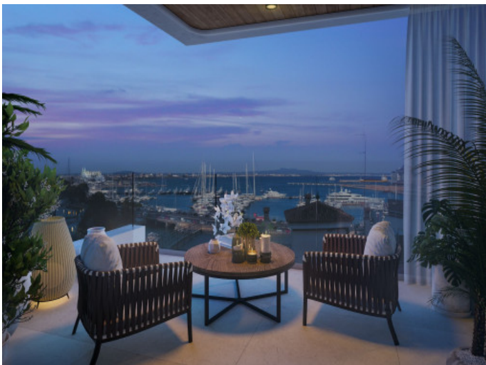
El balcón por la noche