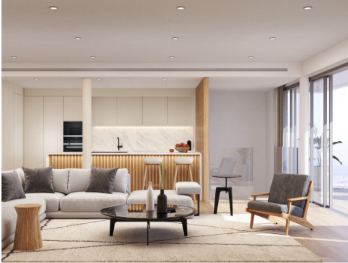
Vista a la cocina