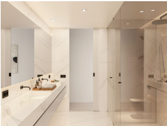
Baño elegante con ducha a nivel del suelo