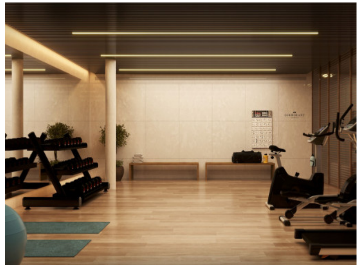
Zona de gimnasio