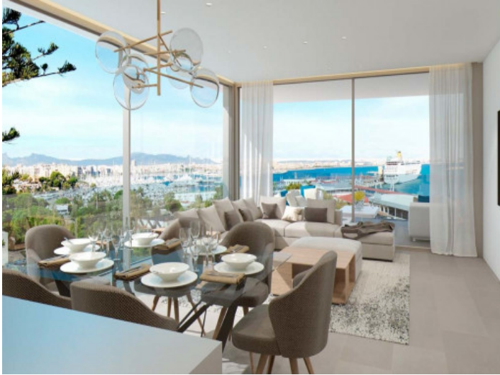
Cocina - comedor