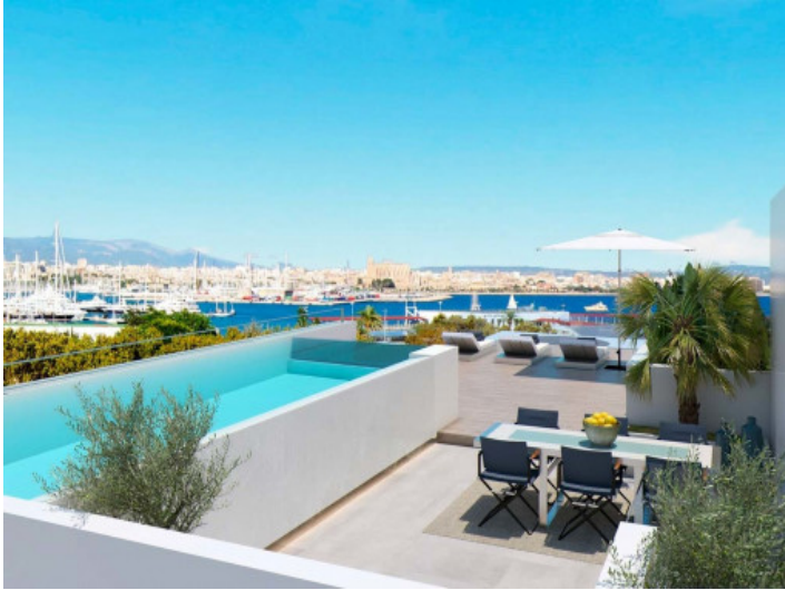
Atico con piscina privada