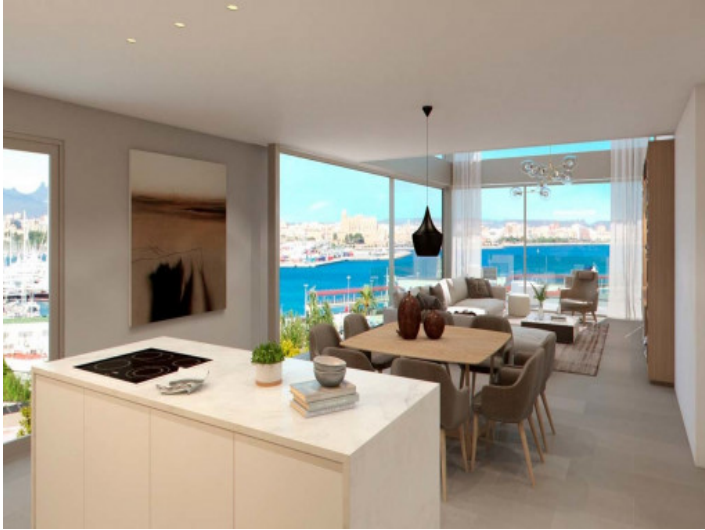
Cocina - comedor