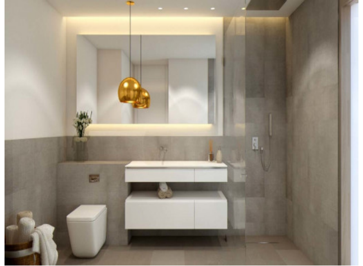
Uno de 4 baños