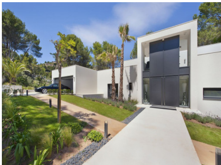
Acceso a la villa