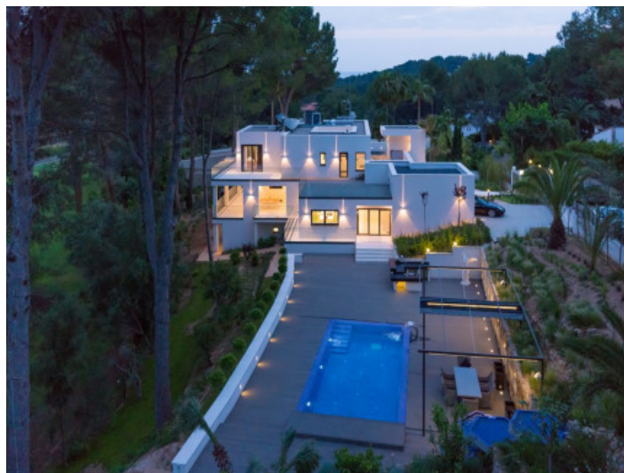
La villa por la noche