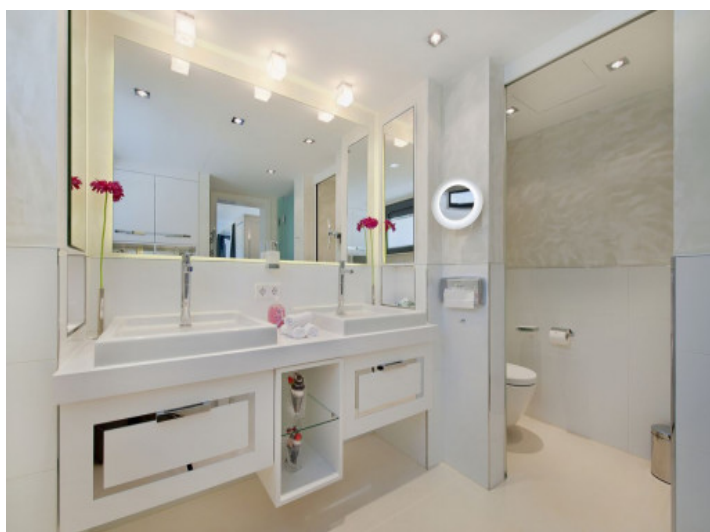
Segundo baño con ducha