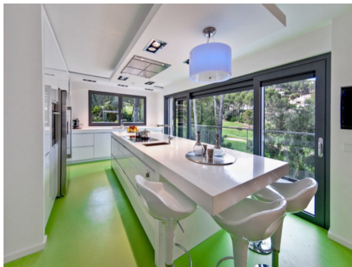
Cocina totalmente equipada con mesa larga