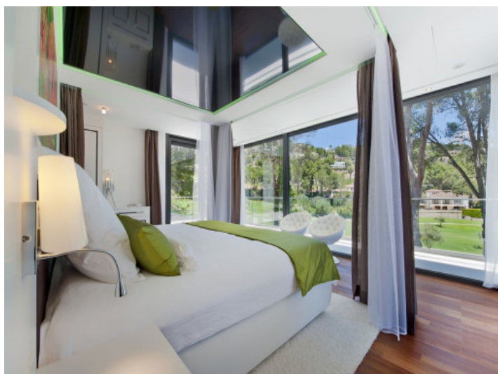
Dormitorio principal con vistas al jardín