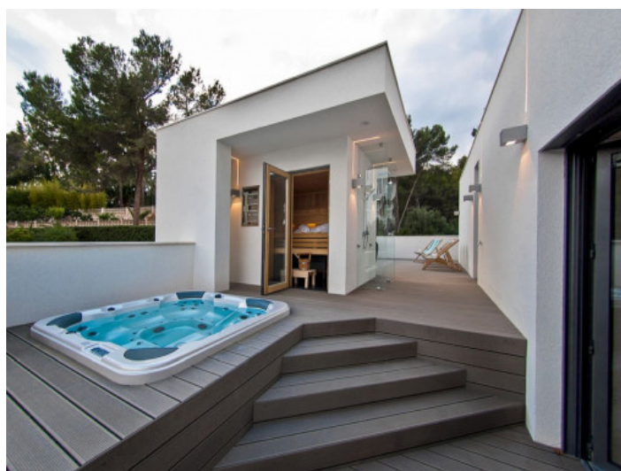
Zona spa fantástica con sauna

Toda la información como mejor se puede saber, salvo por error durante el periodo de venta. Sirva este documento como un informe previo, las bases legales solo serán válidas a través de un contrato de compra acordado ante Notario.