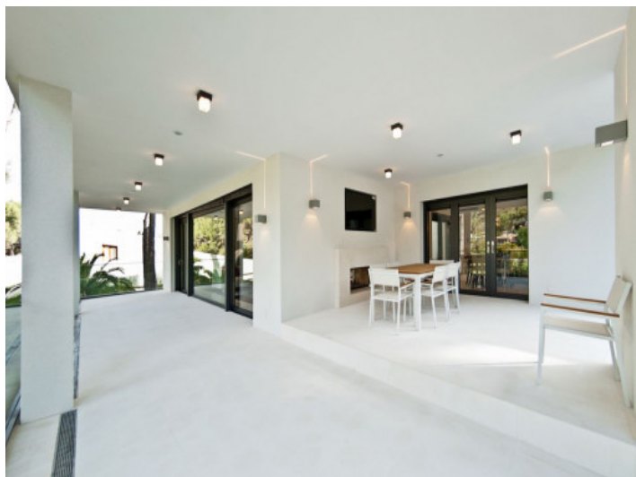
Zona comedor cubierta