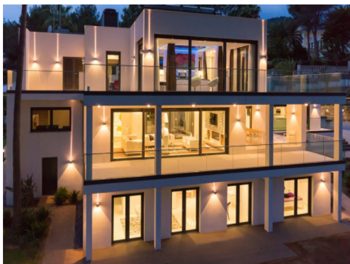
Vista alternativa de la villa