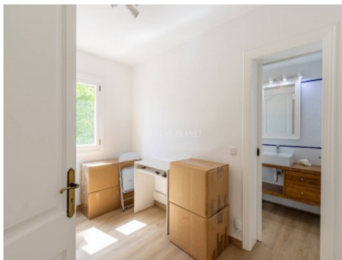
Habitación con baño en suite