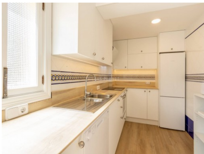
Cocina totalmente equipada