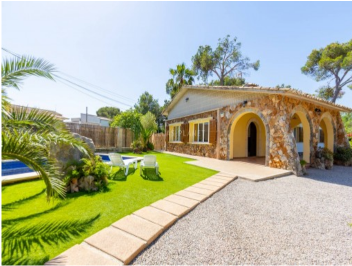
Acceso a la casa