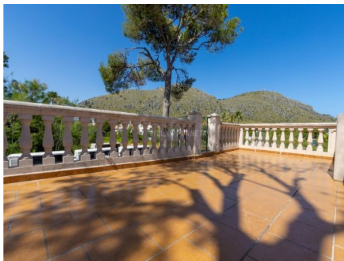
Terraza con vistas al Puig de Son Martí

Toda la información como mejor se puede saber, salvo por error durante el periodo de venta. Sirva este documento como un informe previo, las bases legales solo serán válidas a través de un contrato de compra acordado ante Notario.