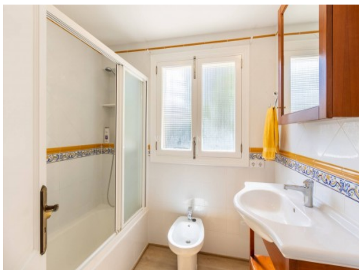
El baño con bañera