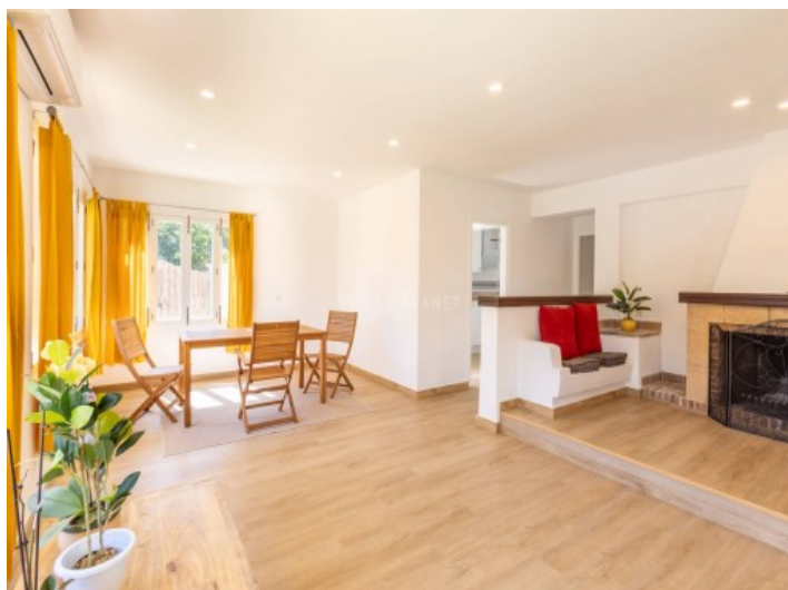
Zona de comedor