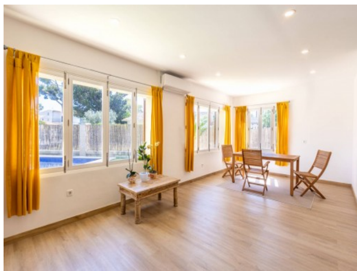
Zona de estar