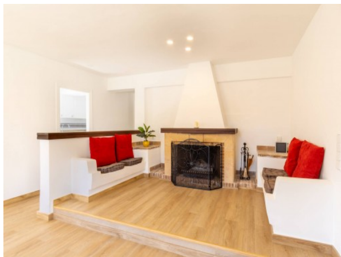
Acogedor rincón de la chimenea

Toda la información como mejor se puede saber, salvo por error durante el periodo de venta. Sirva este documento como un informe previo, las bases legales solo serán válidas a través de un contrato de compra acordado ante Notario.