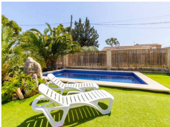
Aéreas buen cuidado con césped que rodea la piscina