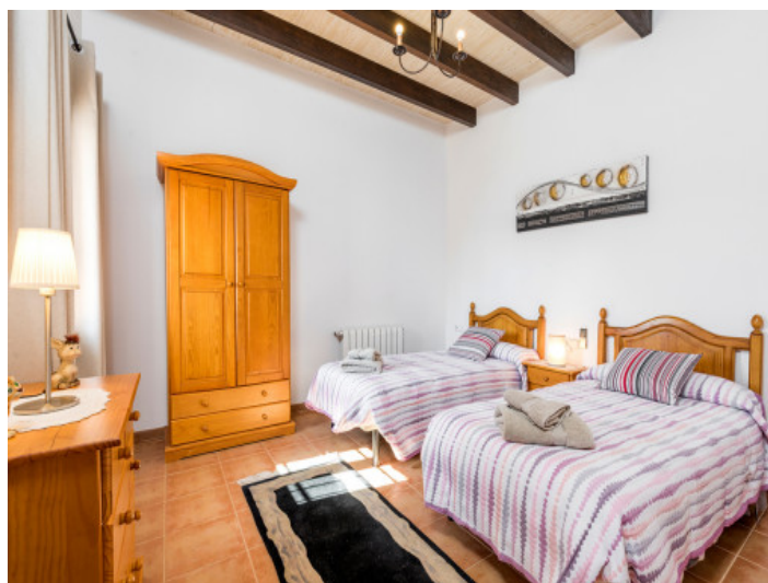
Dormitorio con 2 camas