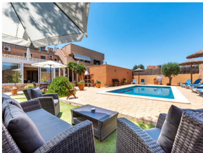
Hermosa área de piscina

Toda la información como mejor se puede saber, salvo por error durante el periodo de venta. Sirva este documento como un informe previo, las bases legales solo serán válidas a través de un contrato de compra acordado ante Notario.