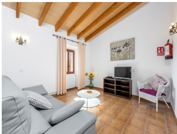
Área de estar inundada de luz en el primer piso

Toda la información como mejor se puede saber, salvo por error durante el periodo de venta. Sirva este documento como un informe previo, las bases legales solo serán válidas a través de un contrato de compra acordado ante Notario.