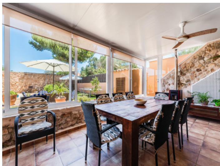
Jardín de invierno con comedor