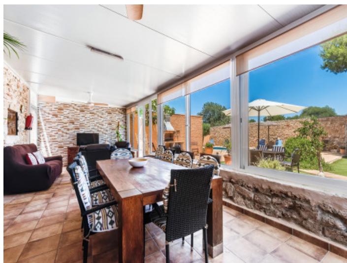
Jardín de invierno con comedor