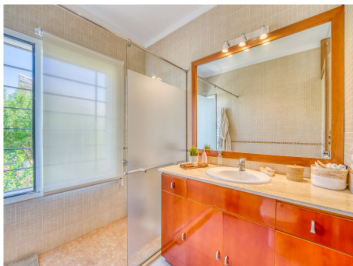
Uno de 4 baños