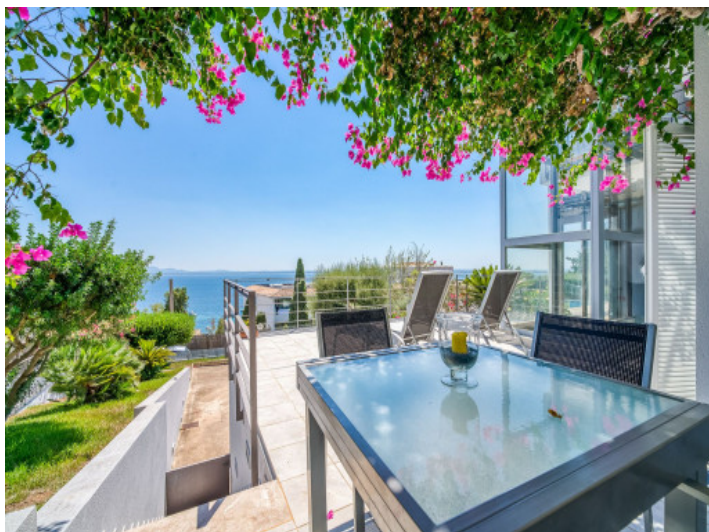
Comedor al aire libre