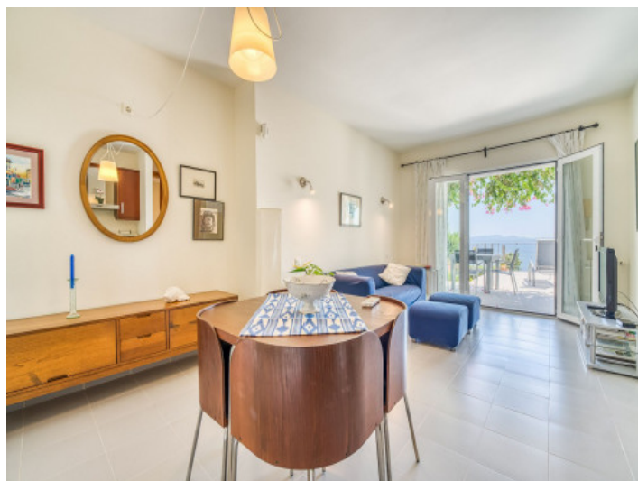
Salón-comedor con salida a la terraza

Toda la información como mejor se puede saber, salvo por error durante el periodo de venta. Sirva este documento como un informe previo, las bases legales solo serán válidas a través de un contrato de compra acordado ante Notario.