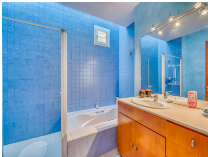
Uno de 4 baños