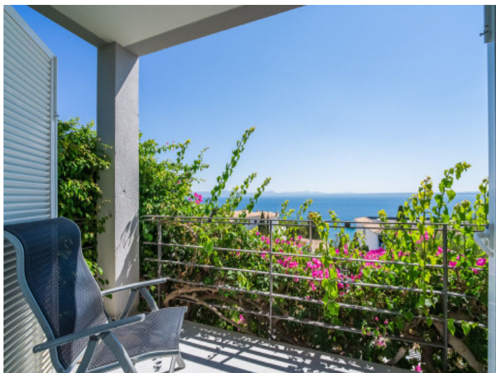
Terraza con vistas al mar