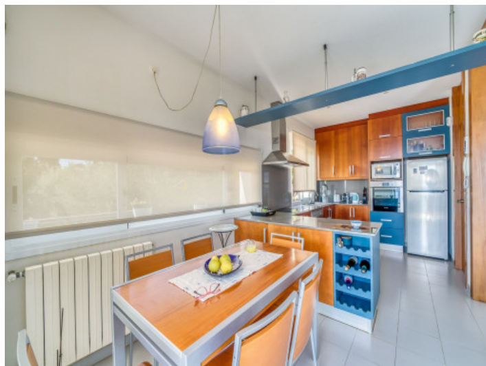
Cocina con office