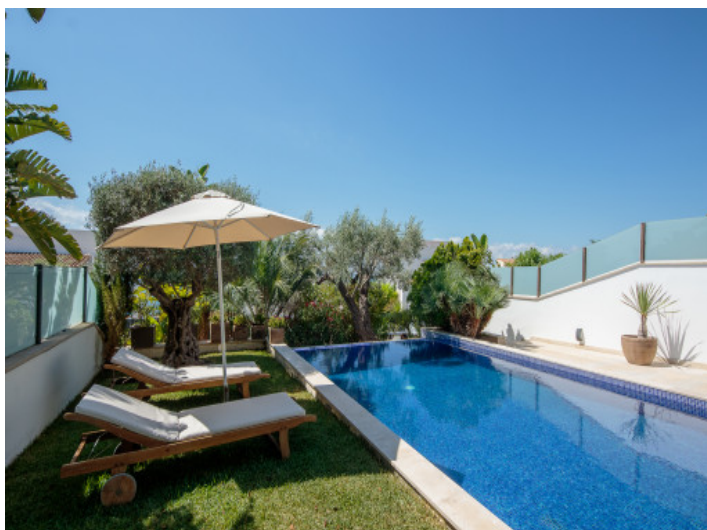
Fabulosa zona de piscina