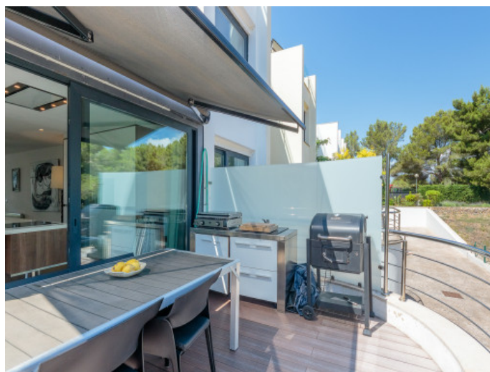
Terraza con zona de barbacoa y tondo