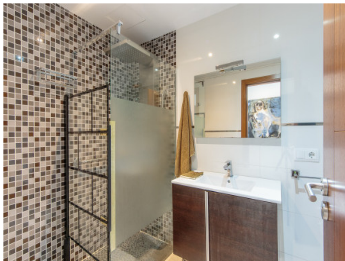
Uno de 3 baños