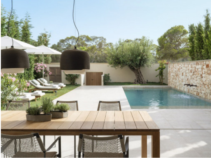
Piscina y terraza