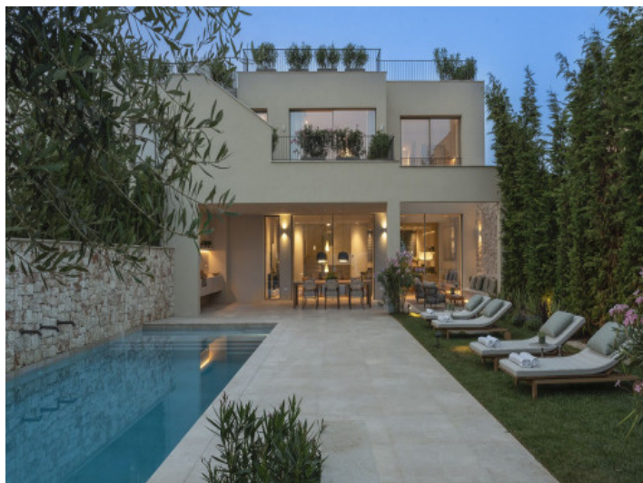
Casa por la noche