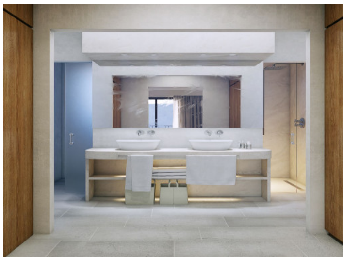
Uno de 4 baños

Toda la información como mejor se puede saber, salvo por error durante el periodo de venta. Sirva este documento como un informe previo, las bases legales solo serán válidas a través de un contrato de compra acordado ante Notario.