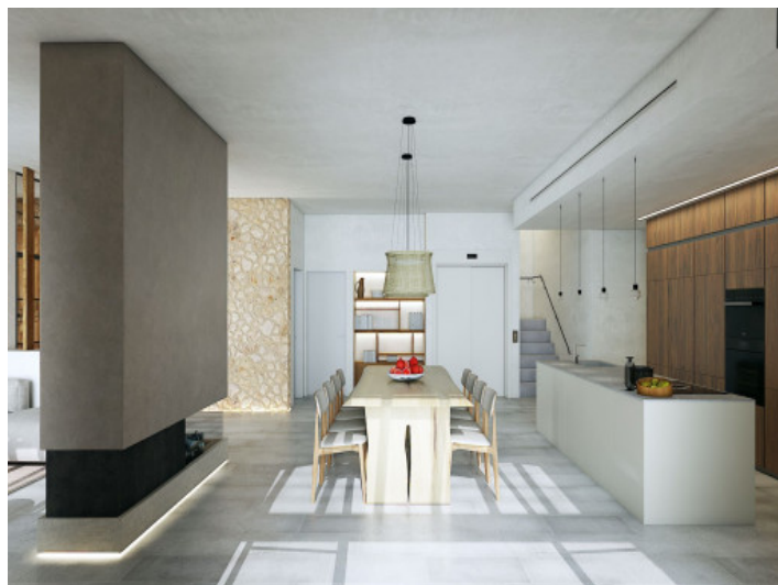
Comedor - Cocina