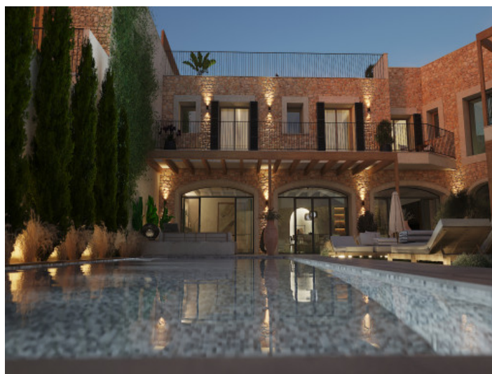
Piscina y jardín