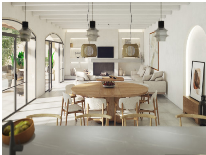
Salon - Comedor

Toda la información como mejor se puede saber, salvo por error durante el periodo de venta. Sirva este documento como un informe previo, las bases legales solo serán validas a traves de un contrato de compra acordado ante Notario.