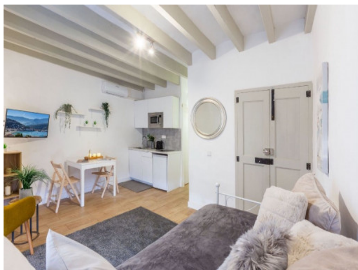
Entrada y cocina