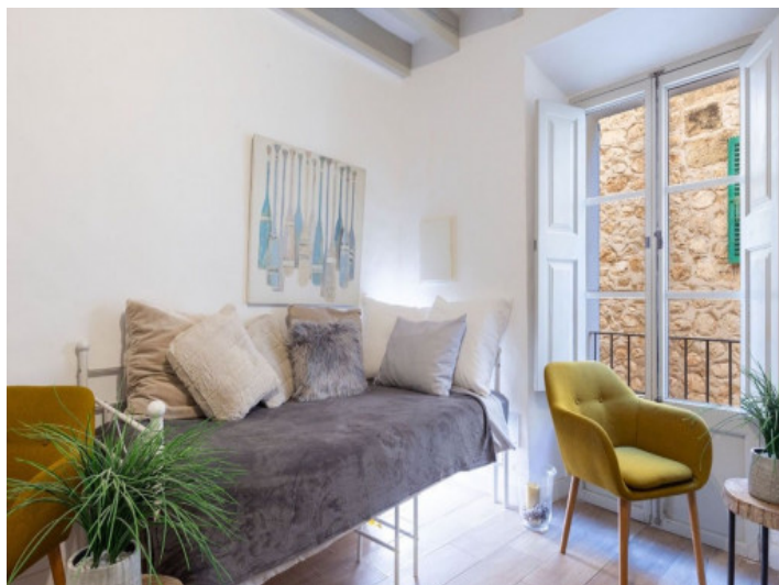
Casa de pueblo con encanto en Soller