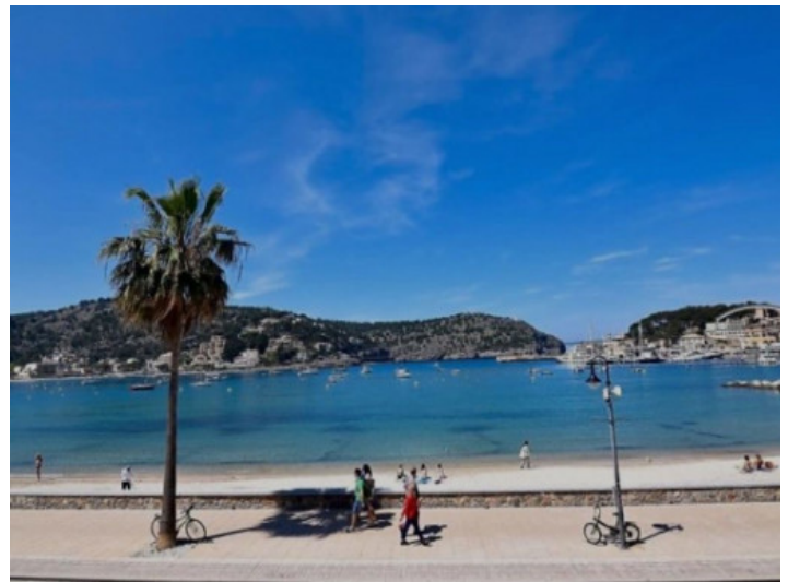
Port de Soller