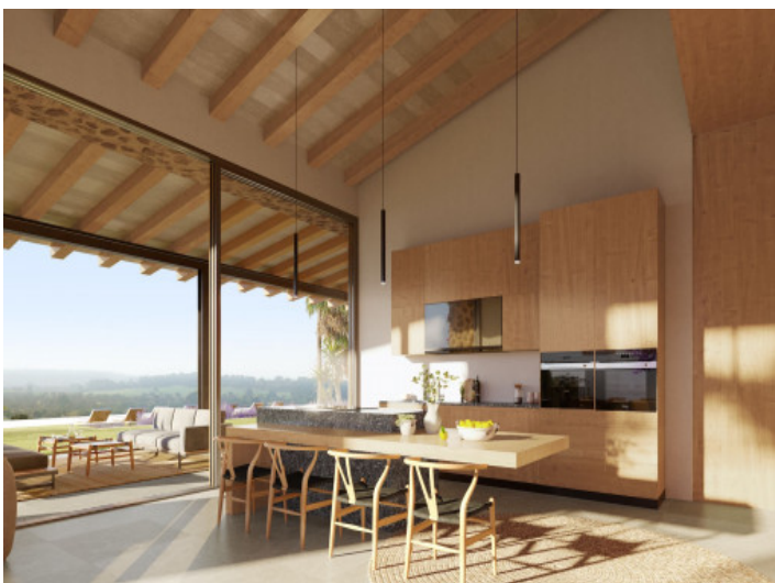
Cocina moderna con isla central