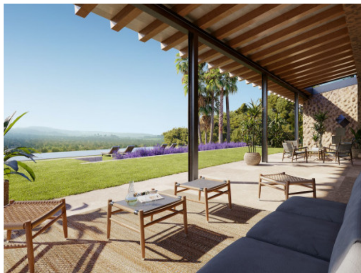
Terraza y jardín