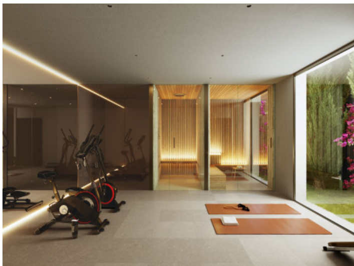
Zona del spa y gimnasio