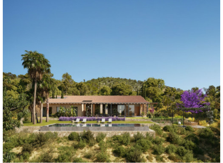
Jardín espacioso con piscina