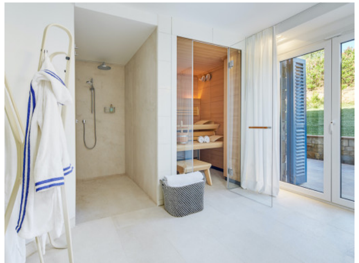
Zona de spa con sauna