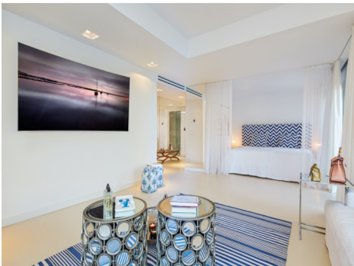
Dormitorio principal con baño y salón en suite