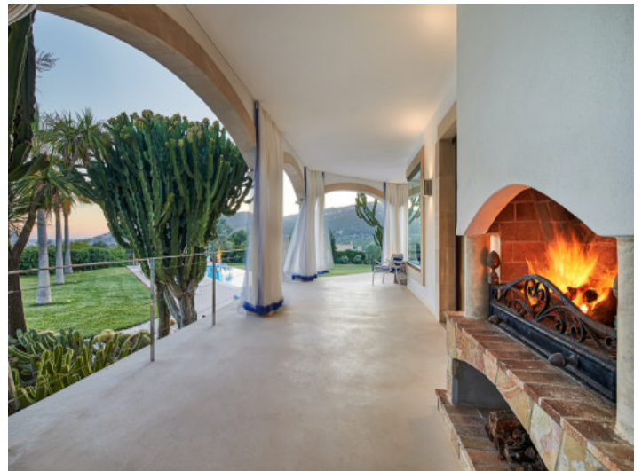
Terraza con chimenea