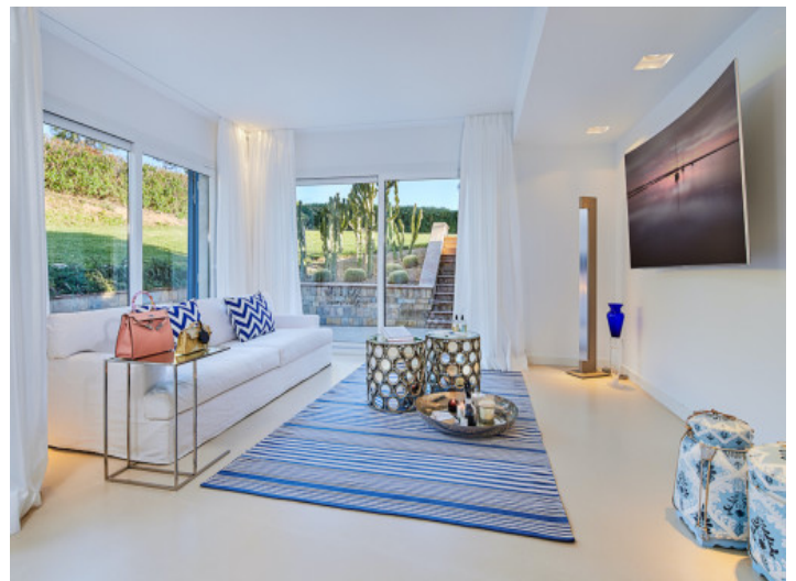
Dormitorio principal con baño y salón en suite

Toda la información como mejor se puede saber, salvo por error durante el periodo de venta. Sirva este documento como un informe previo, las bases legales solo serán válidas a través de un contrato de compra acordado ante Notario.