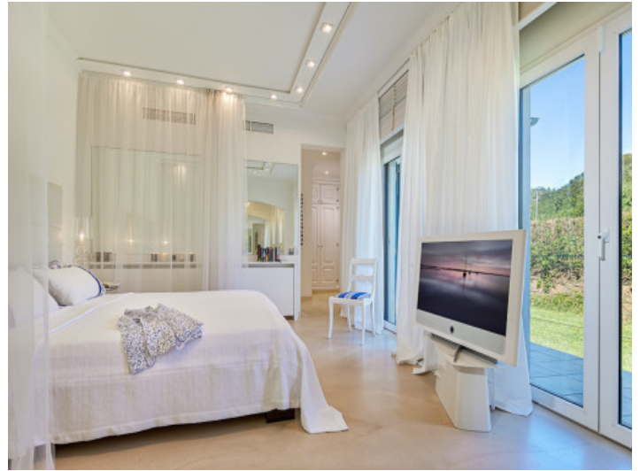
Otro dormitorio doble