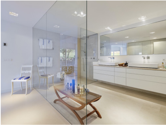
Baño en suite