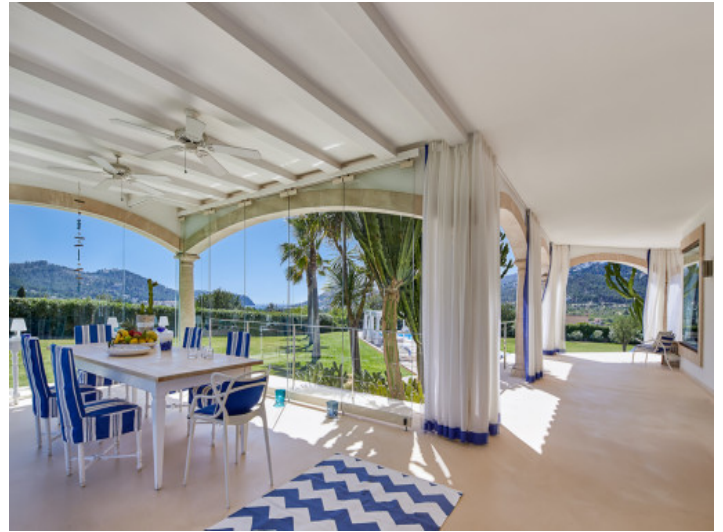
Terraza cubierta con comedor