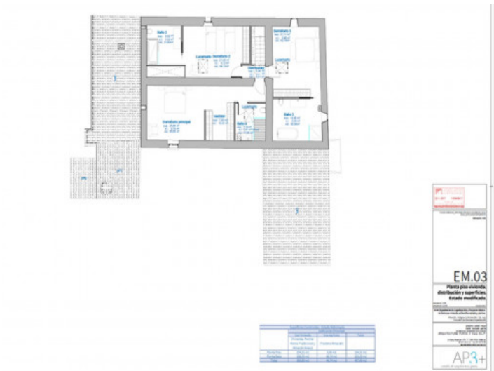
Plano planta primera

Toda la información como mejor se puede saber, salvo por error durante el periodo de venta. Sirva este documento como un informe previo, las bases legales solo serán válidas a través de un contrato de compra acordado ante Notario.