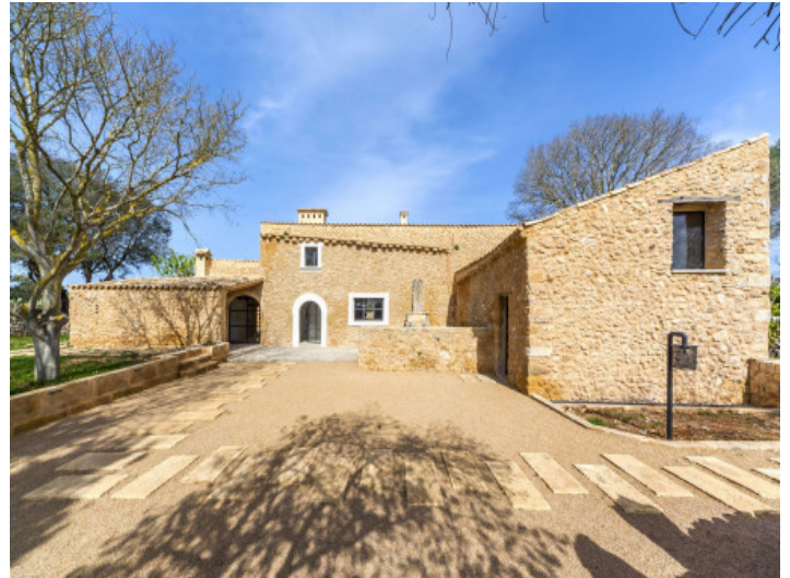
Vista frontal y entrada