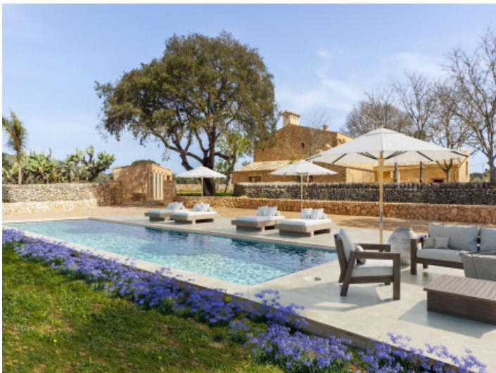
Zona exterior con piscina