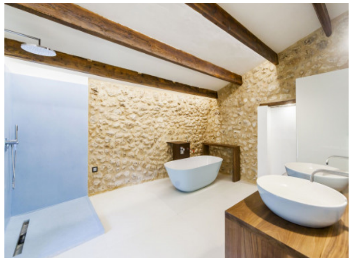
Uno de 4 baños

Toda la información como mejor se puede saber, salvo por error durante el periodo de venta. Sirva este documento como un informe previo, las bases legales solo serán válidas a través de un contrato de compra acordado ante Notario.