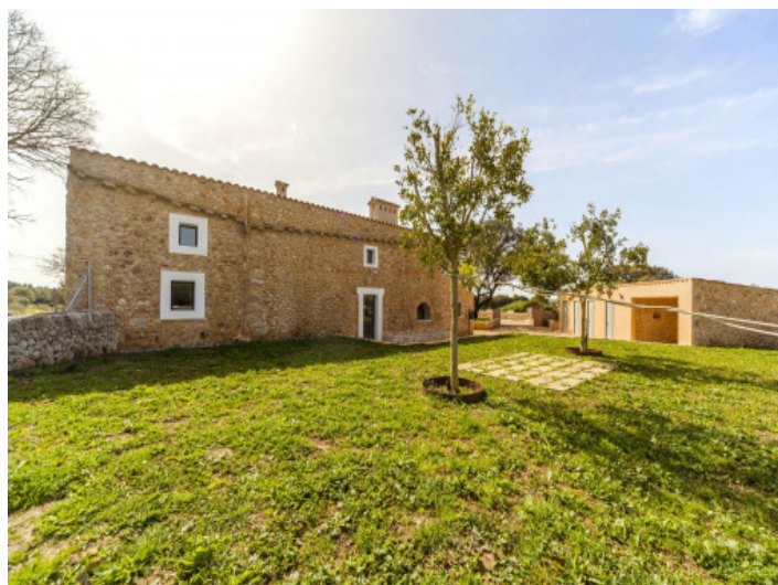
Finca y jardín

Toda la información como mejor se puede saber, salvo por error durante el periodo de venta. Sirva este documento como un informe previo, las bases legales solo serán válidas a través de un contrato de compra acordado ante Notario.