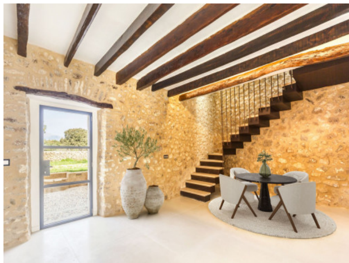
Habitación con acceso desde el exterior