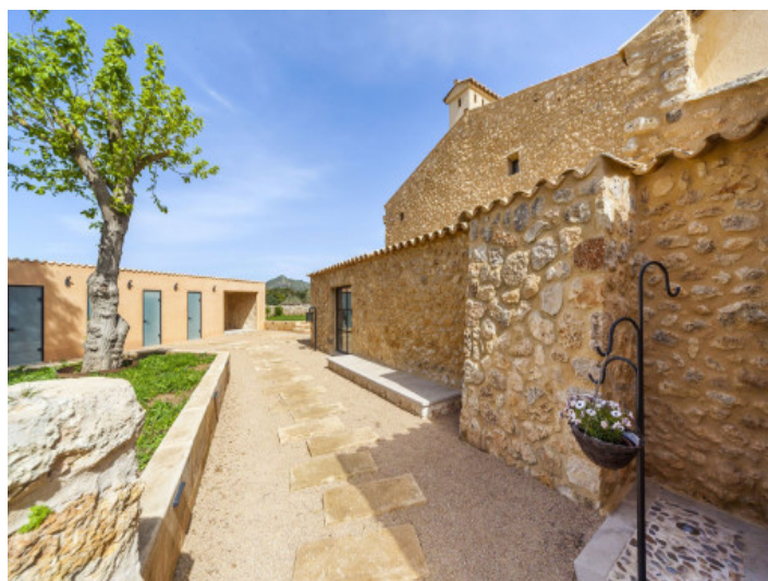
Finca y zona exterior