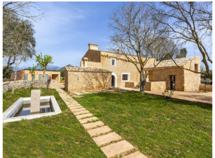
Finca y área exterior