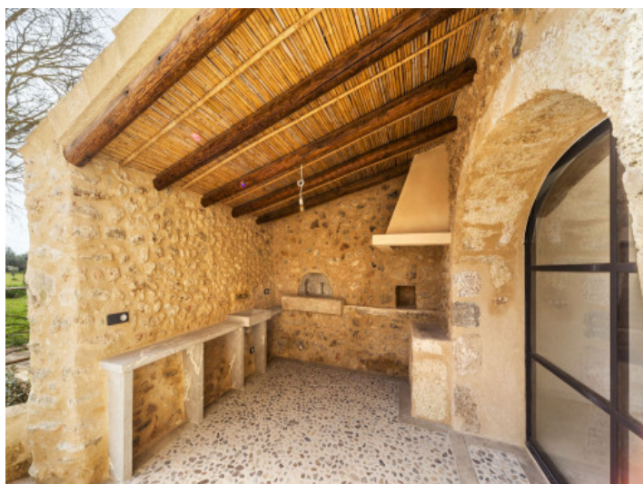
Zona de barbacoa