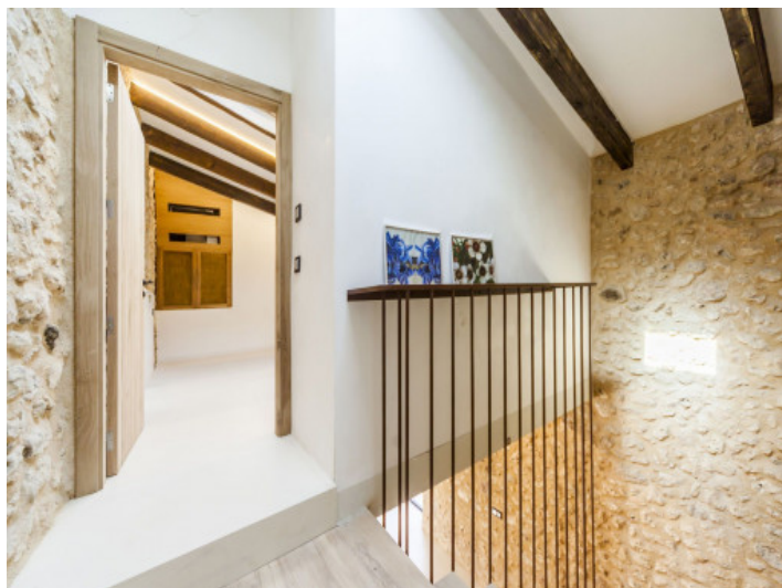
Corredor en la planta superior