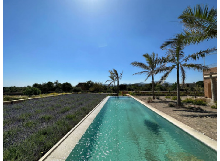
Área de piscina