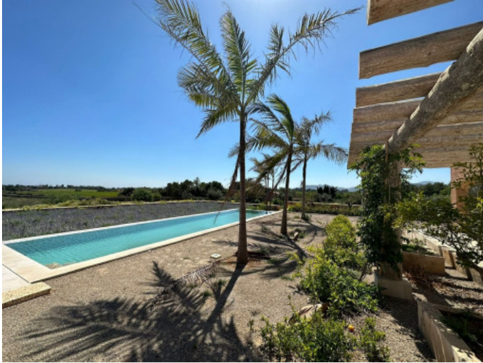
Área de piscina