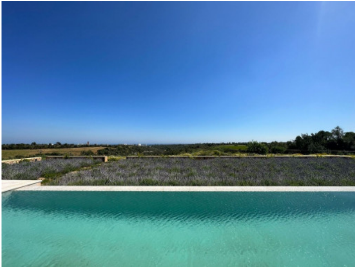
Área de piscina