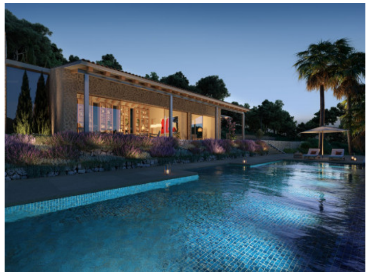
Piscina durante la noche

Toda la información como mejor se puede saber, salvo por error durante el periodo de venta. Sirva este documento como un informe previo, las bases legales solo serán validas a traves de un contrato de compra acordado ante Notario.