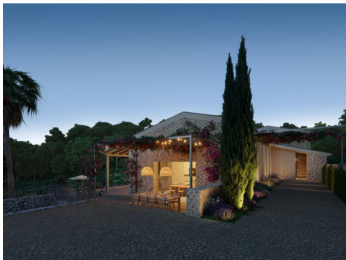
Finca durante la noche