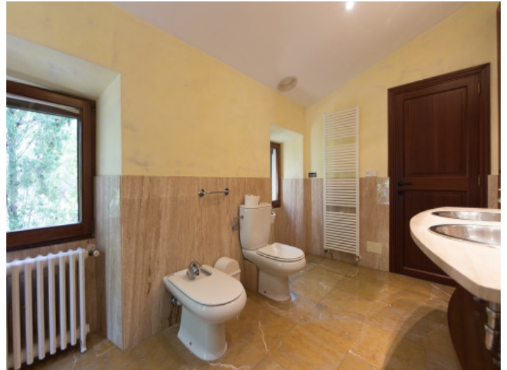
Baño con luz natural