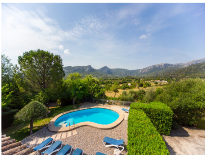
Vistas unicas al campo