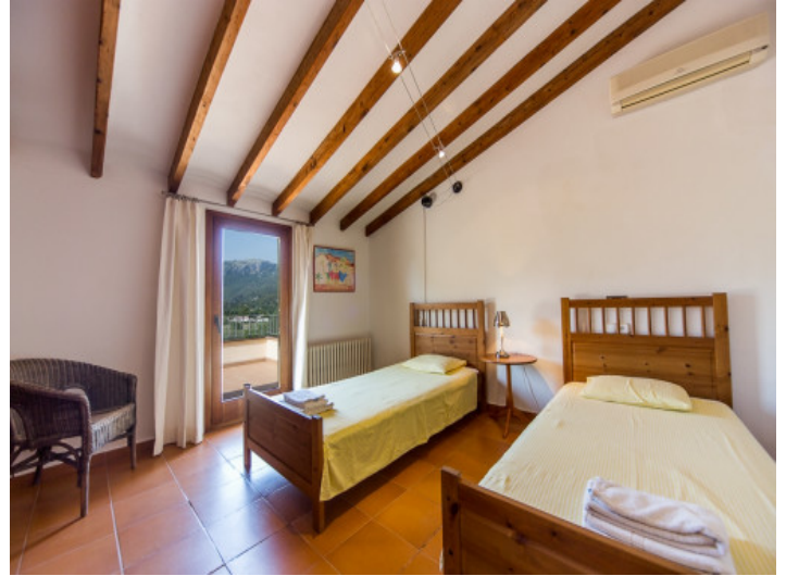
Dormitorio con aire acondicionado