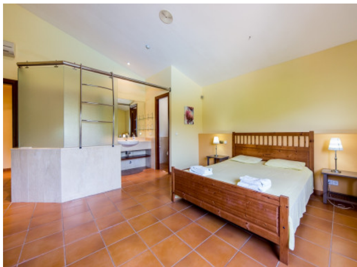
Dormitorio con baño en suite