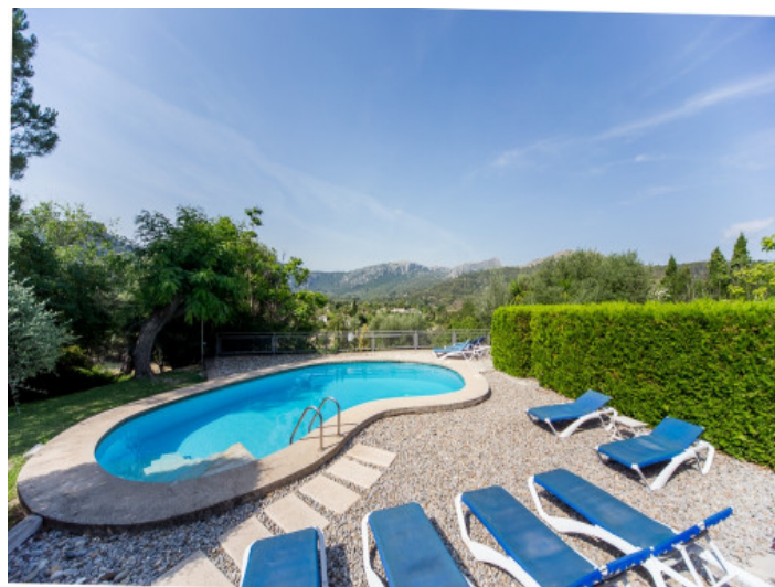
Piscina está rodeada con una terraza