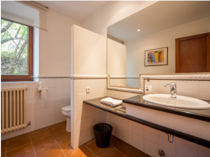
Baño con calefacción