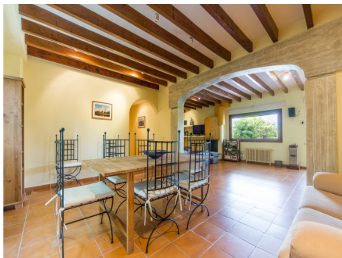
Salón y comedor abierto

Toda la información como mejor se puede saber, salvo por error durante el periodo de venta. Sirva este documento como un informe previo, las bases legales solo serán válidas a través de un contrato de compra acordado ante Notario.