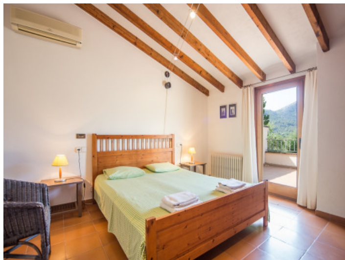
Dormitorio con balcón