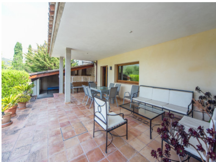
Terraza cubierta con área de comer