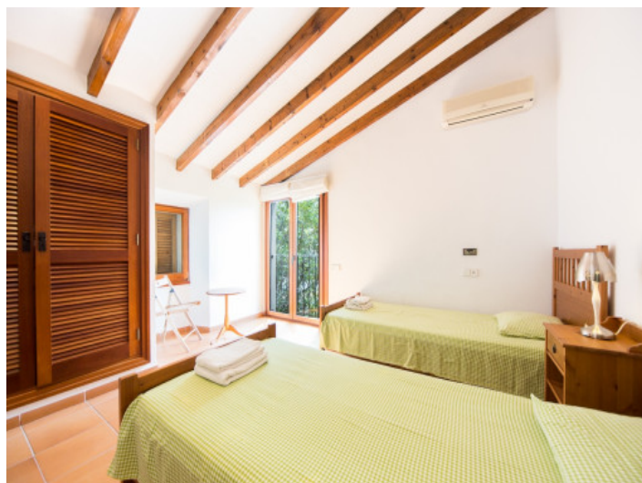
Dormitorio con armario empotrado

Toda la información como mejor se puede saber, salvo por error durante el periodo de venta. Sirva este documento como un informe previo, las bases legales solo serán válidas a través de un contrato de compra acordado ante Notario.