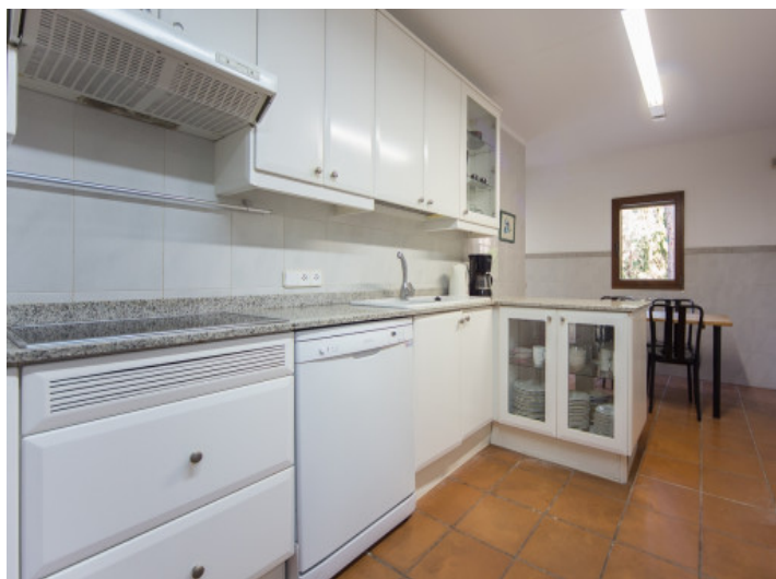
Cocina total equipada