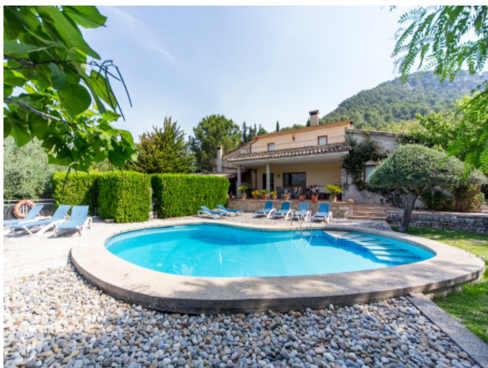
Área de piscina idílica