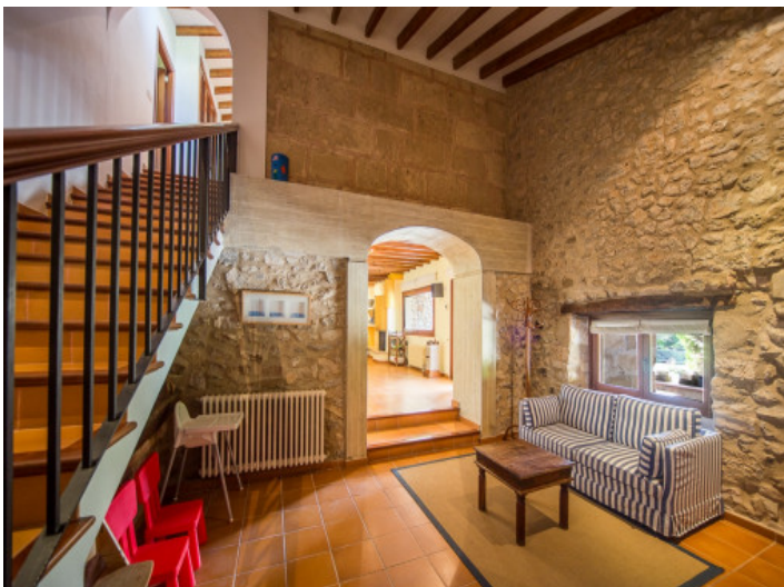
Área de estar en el corredor