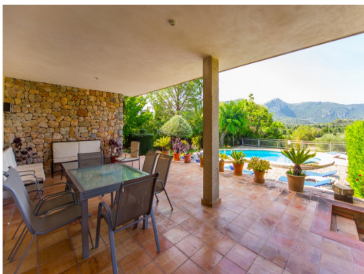
Vistas desde la terraza a la piscina