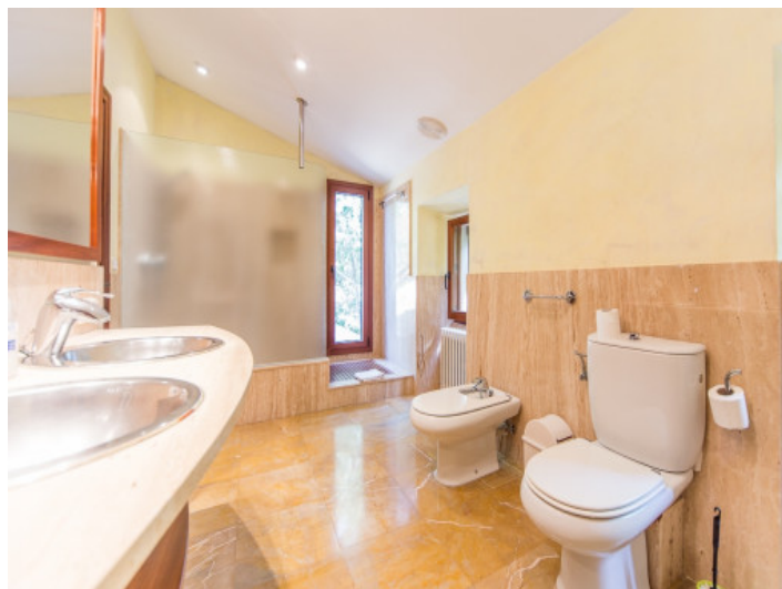
Baño con bañera y luz natural