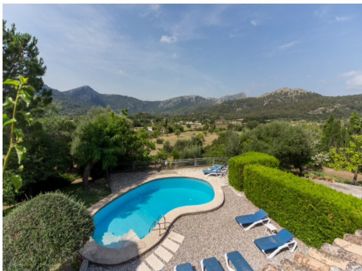
Piscina bien cuidada