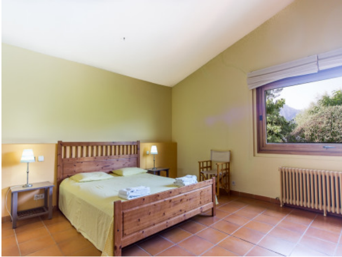
Dormitorio con calefacción