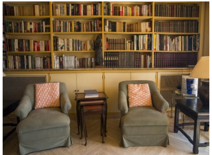
Una pared de piedra natural decora la zona de estar