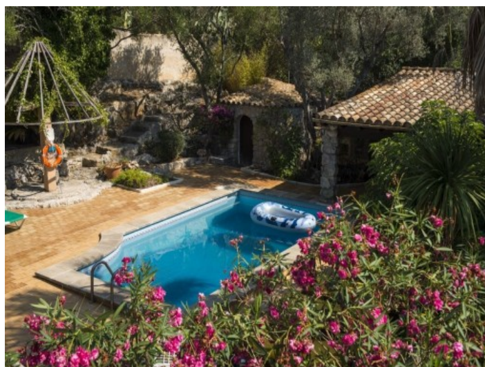
Casa de huéspedes separada de la finca