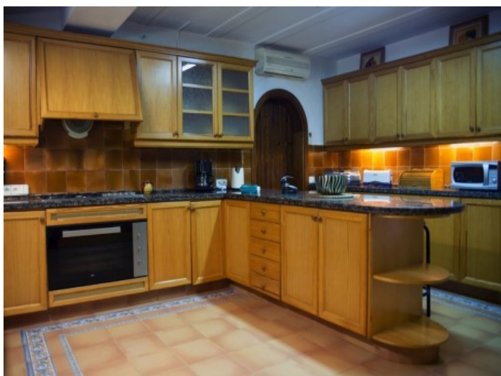
Cocina totalmente equipada