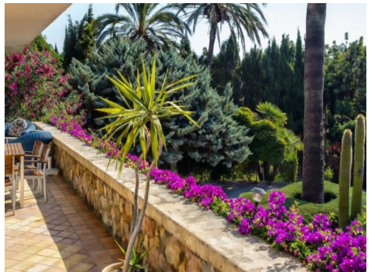
Hamacas atractivas en el área de piscina

Toda la información como mejor se puede saber, salvo por error durante el periodo de venta. Sirva este documento como un informe previo, las bases legales solo serán válidas a través de un contrato de compra acordado ante Notario.