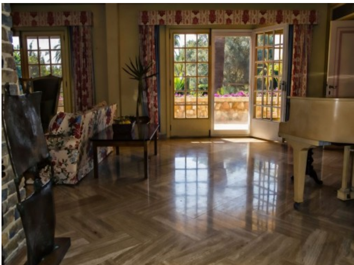
Pequeña biblioteca con sillones