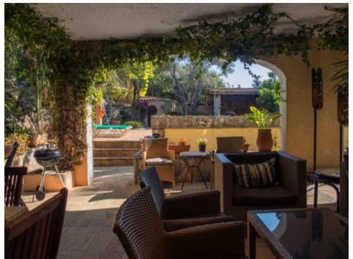
Las escaleras que dan acceso a los dormitorios

Toda la información como mejor se puede saber, salvo por error durante el periodo de venta. Sirva este documento como un informe previo, las bases legales solo serán válidas a través de un contrato de compra acordado ante Notario.