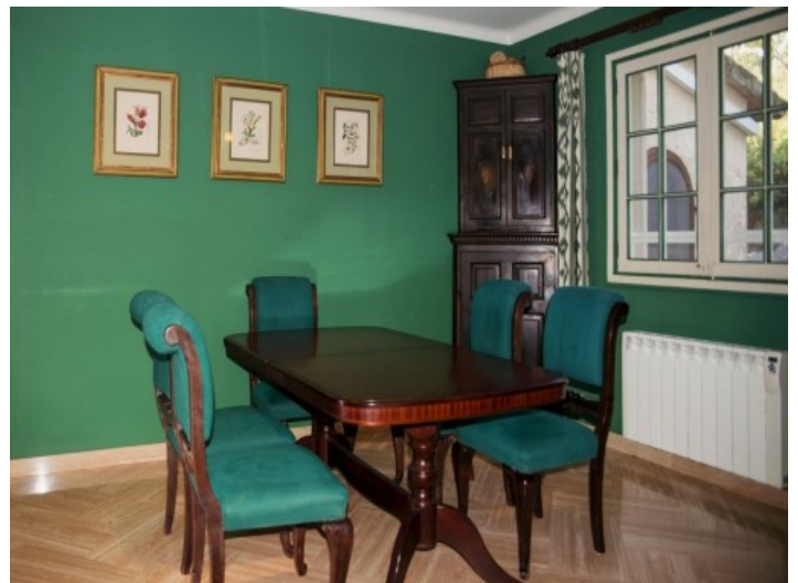
Acceso a la terraza

Toda la información como mejor se puede saber, salvo por error durante el periodo de venta. Sirva este documento como un informe previo, las bases legales solo serán válidas a través de un contrato de compra acordado ante Notario.