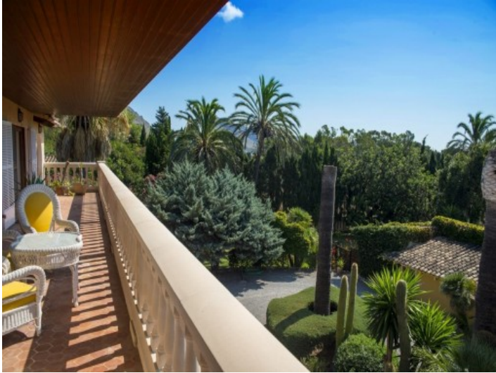
Camino de entrada larga de la propiedad