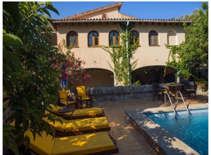
Área de barbacoa al lado de la piscina