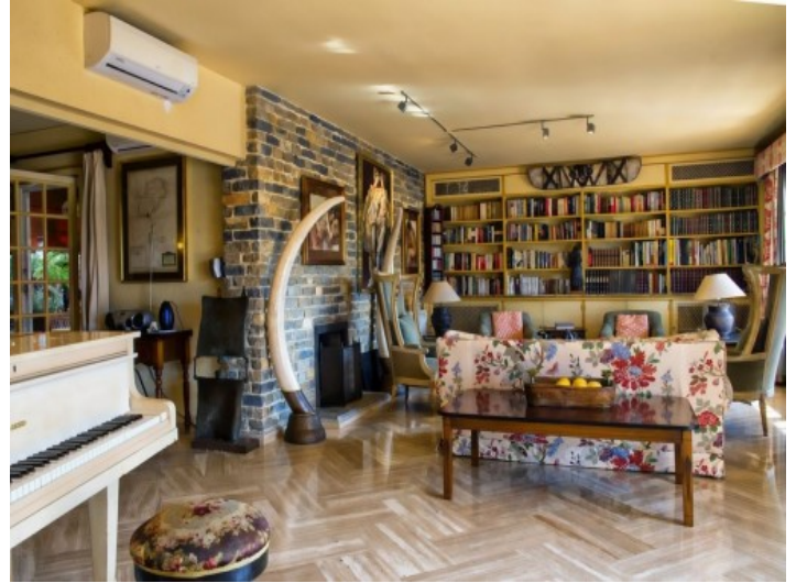
Buenas vistas desde el balcón