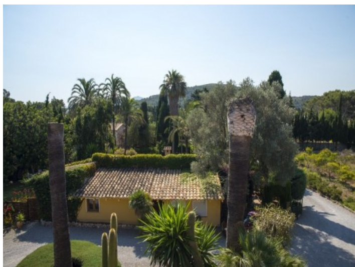
Vistas desde la terraza