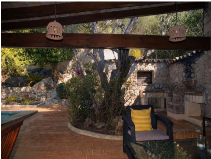
La propiedad está rodeada de la naturaleza