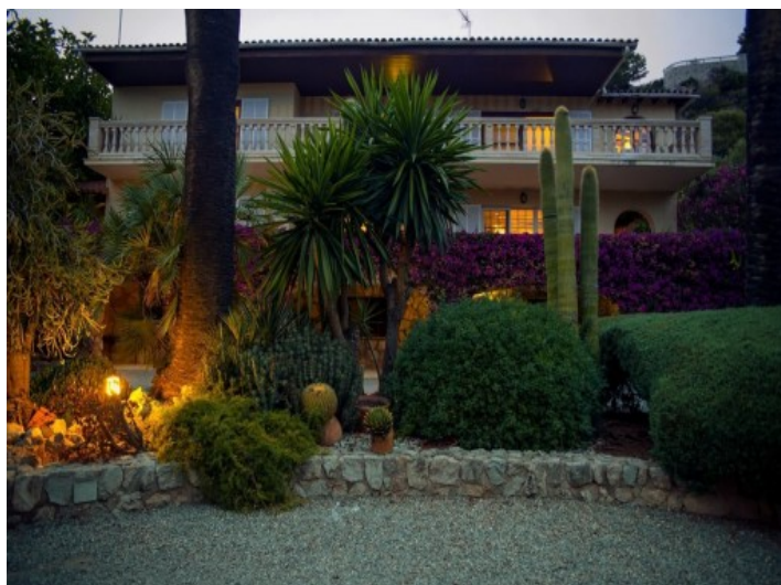
Vistas exteriores de la finca