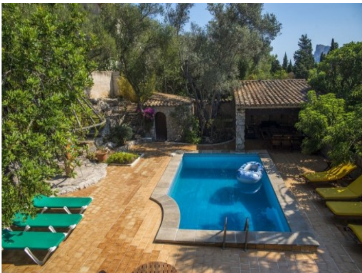
Área de piscina principal de la finca