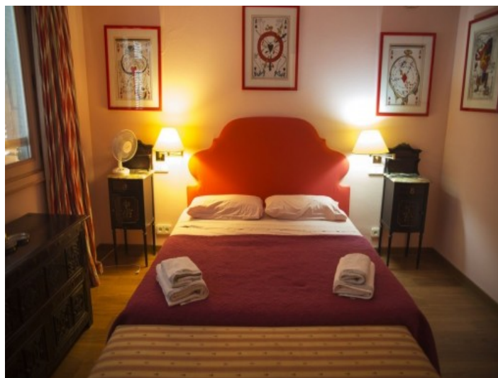
La propiedad ofrece 6 dormitorios

Toda la información como mejor se puede saber, salvo por error durante el periodo de venta. Sirva este documento como un informe previo, las bases legales solo serán válidas a través de un contrato de compra acordado ante Notario.