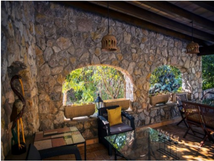
Zona de chill-out cubierta