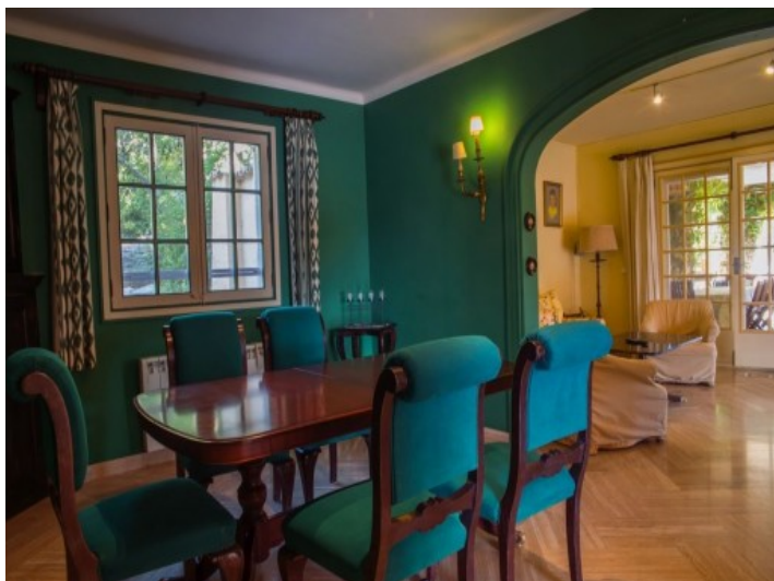
Zona de estar en verde