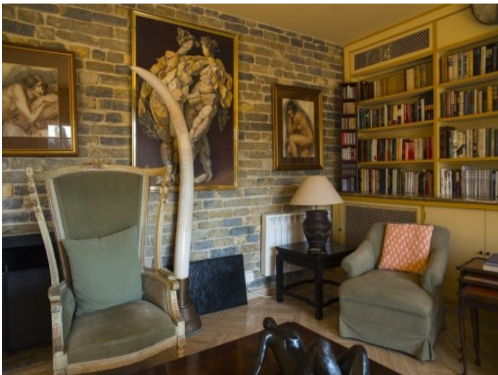
Área de estar con chimenea