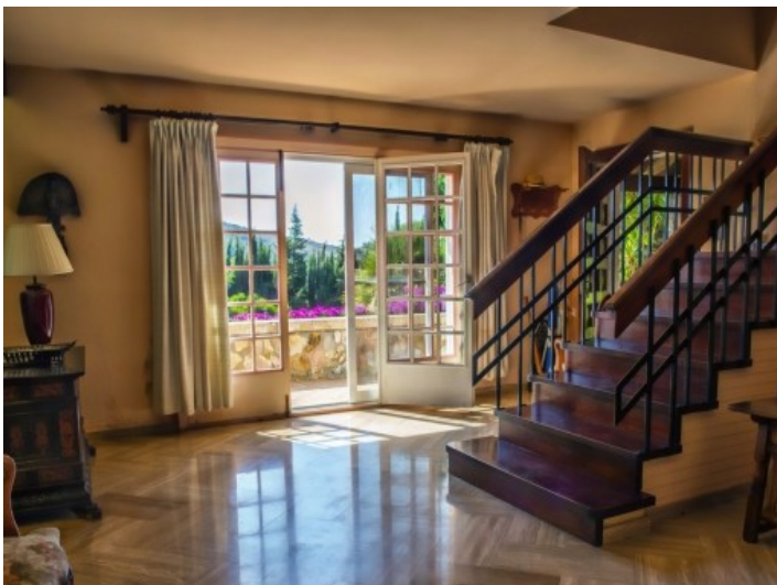
La finca ofrece varios áreas de estar