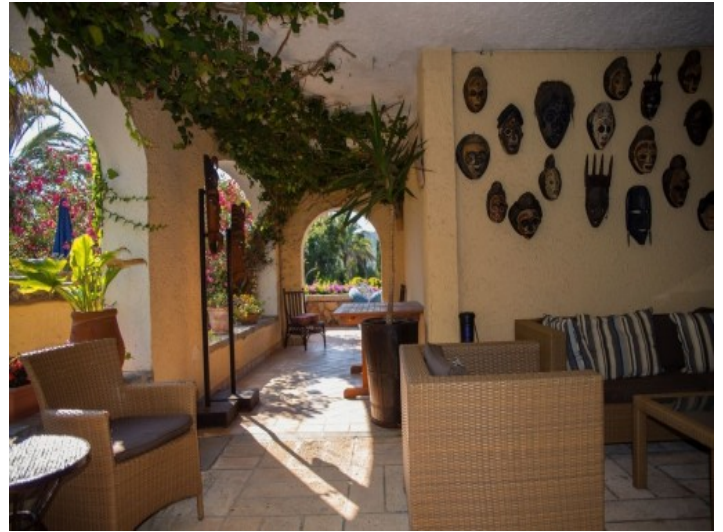
2 casas separadas ofrecen espacio para huéspedes