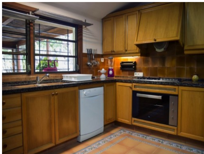
Vistas alternativas de la zona de estar