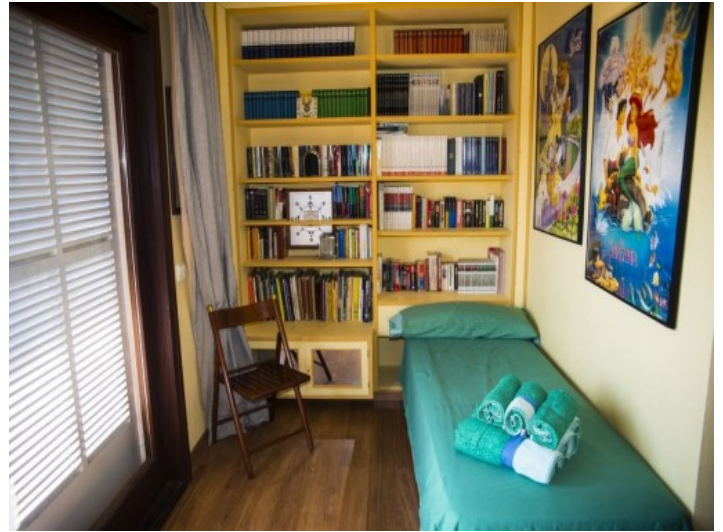
Dormitorio de huéspedes con cama alta práctica