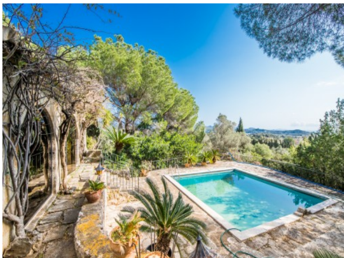
Área de piscina