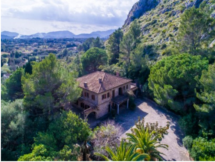
Vista desde arriba