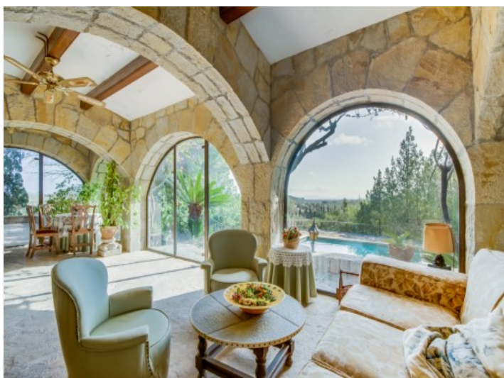
Jardín de invierno