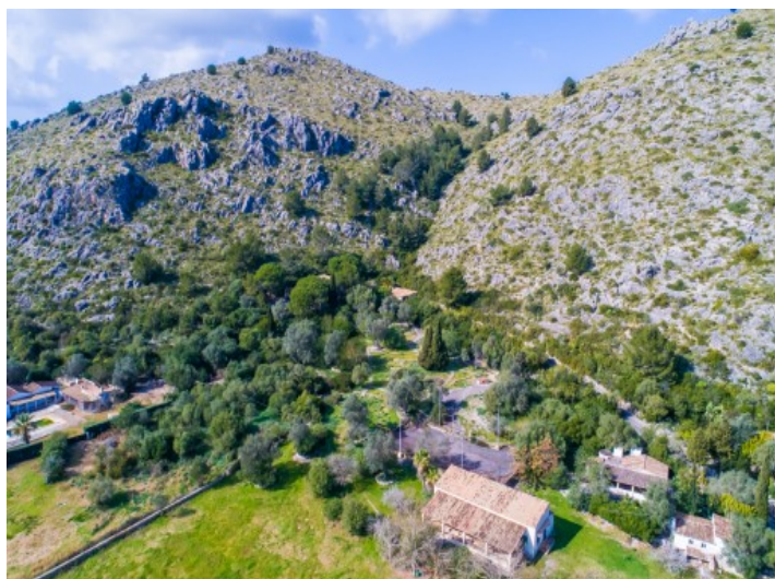
Vista desde arriba