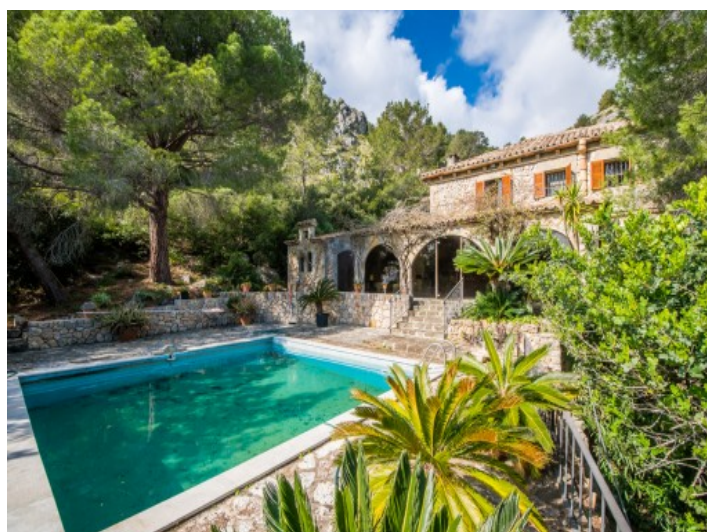
Área de piscina

Toda la información como mejor se puede saber, salvo por error durante el periodo de venta. Sirva este documento como un informe previo, las bases legales solo serán válidas a través de un contrato de compra acordado ante Notario.