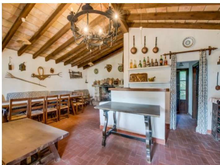
Casa de barbacoa