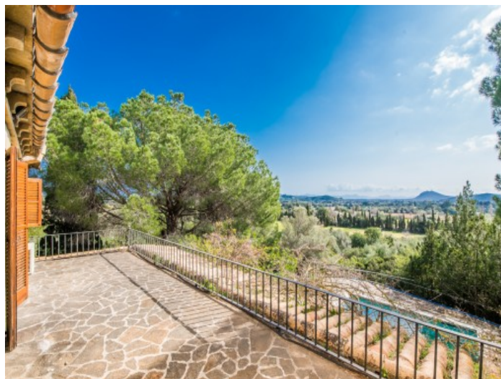
Terraza y vistas