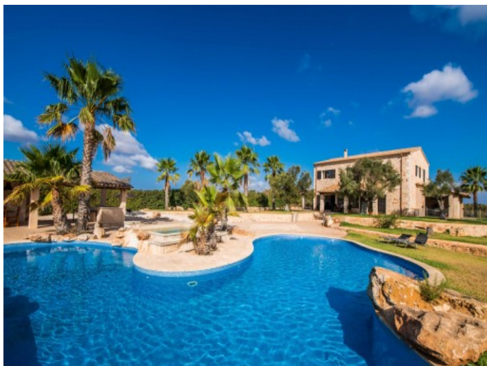
Área de piscina