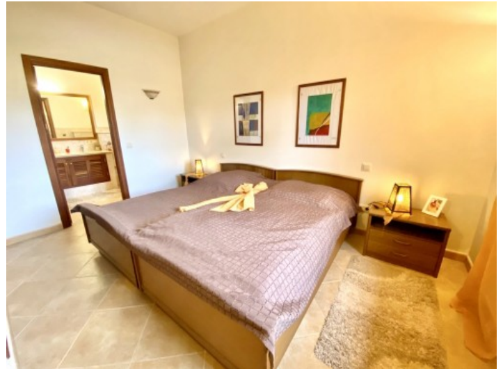
Uno den 6 dormitorios