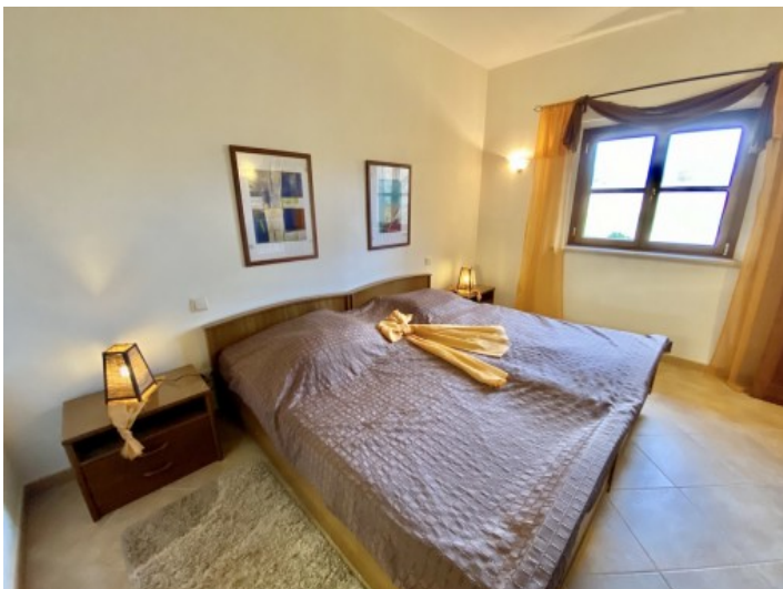
Uno den 6 dormitorios