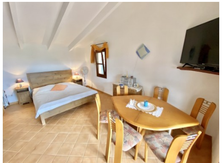
Uno den 6 dormitorios

Toda la información como mejor se puede saber, salvo por error durante el periodo de venta. Sirva este documento como un informe previo, las bases legales solo serán validas a traves de un contrato de compra acordado ante Notario.