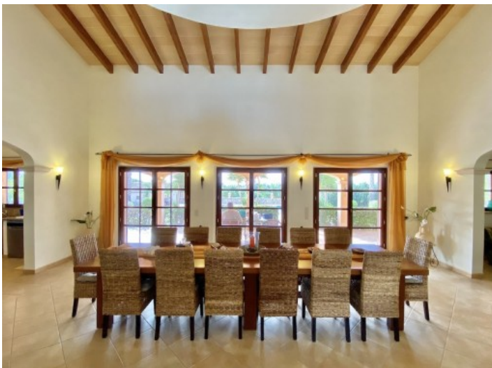
Vista alternativa al comedor