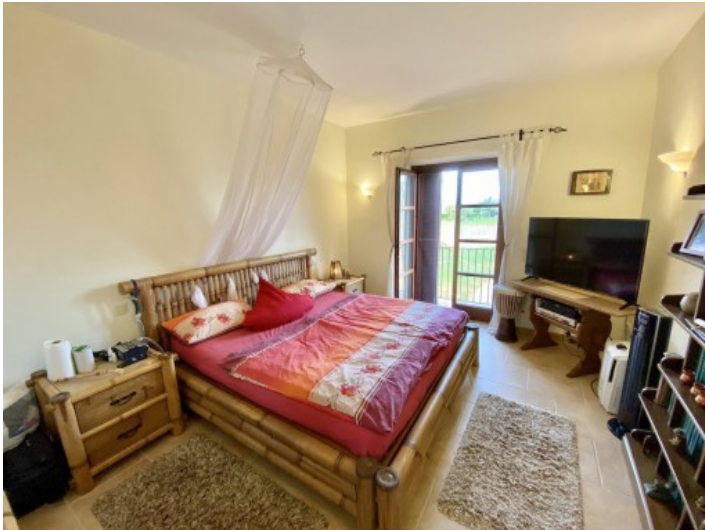
Uno den 6 dormitorios