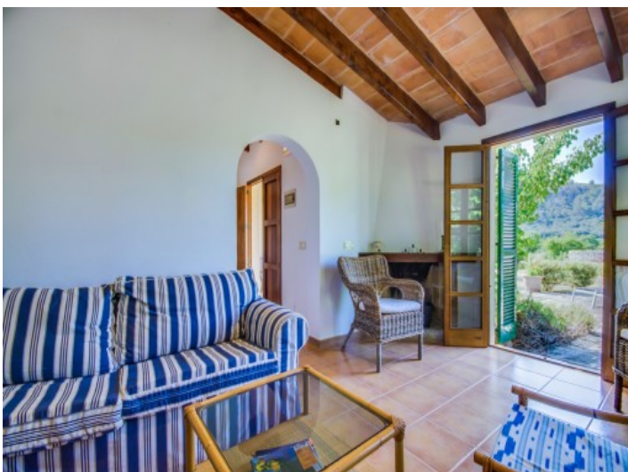
Zona de estar