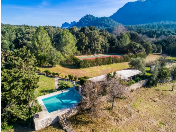
Vista exterior de la propiedad