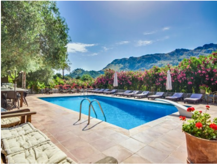
Piscina atractiva en el sol