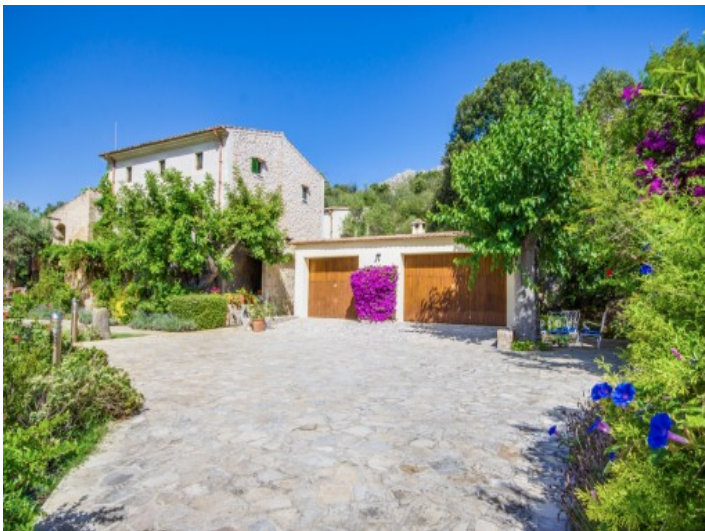
Entrada con un garaje doble