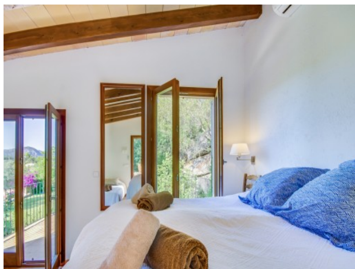
Dormitorio doble con balcón