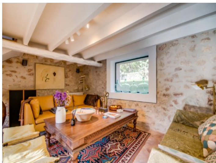
Zona de estar separada