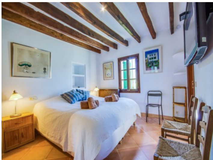
Dormitorio doble con baño en suite