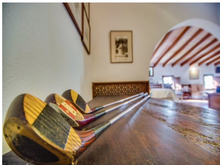
Dormitorio principal con zona de estar

Toda la información como mejor se puede saber, salvo por error durante el periodo de venta. Sirva este documento como un informe previo, las bases legales solo serán válidas a través de un contrato de compra acordado ante Notario.