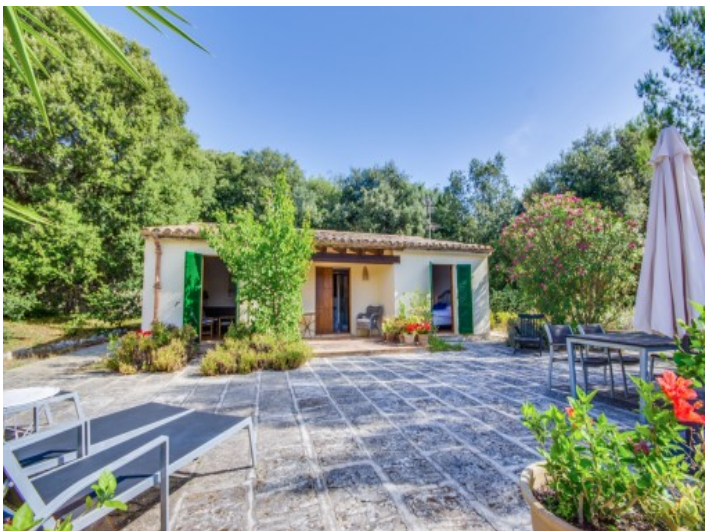
Vista exterior de la casa de huéspedes