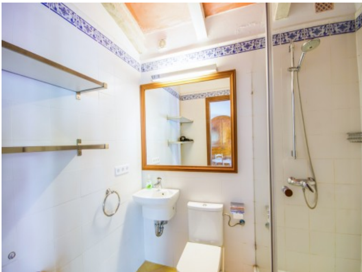
Baño con ducha