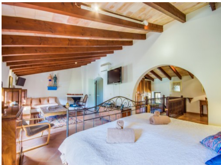
Dormitorio principal con zona de estar