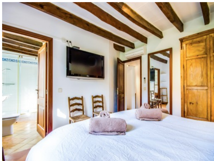
Dormitorio doble con baño en suite