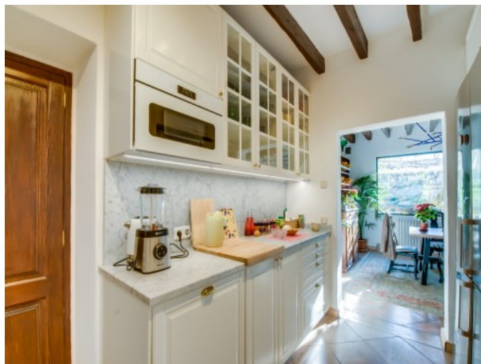
Cocina moderna en blanca