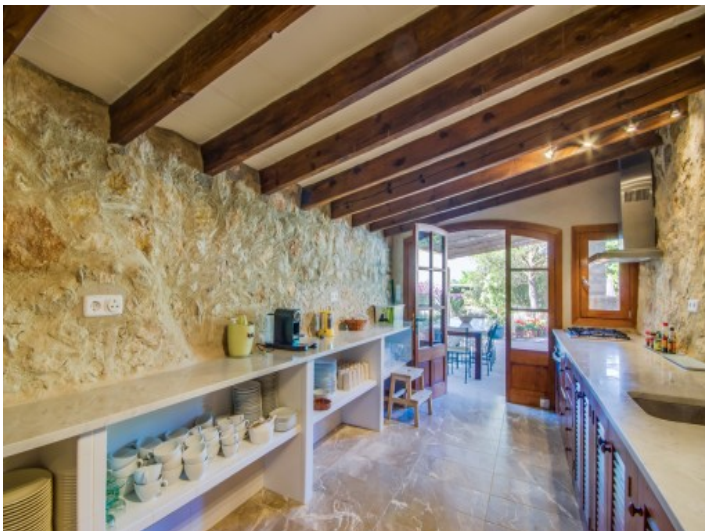
Cocina rústica exterior