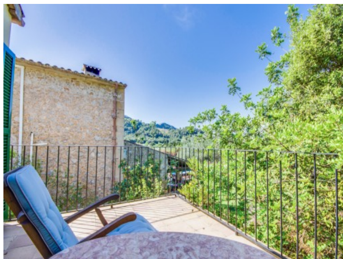
Balcón con zona de estar

Toda la información como mejor se puede saber, salvo por error durante el periodo de venta. Sirva este documento como un informe previo, las bases legales solo serán válidas a través de un contrato de compra acordado ante Notario.