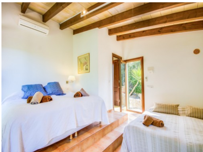
Dormitorio doble con balcón