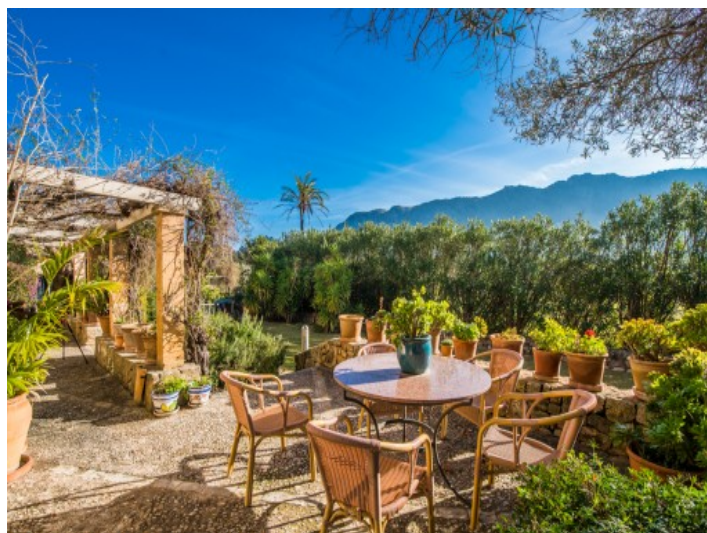
Otra terraza con zona de estar

Toda la información como mejor se puede saber, salvo por error durante el periodo de venta. Sirva este documento como un informe previo, las bases legales solo serán válidas a través de un contrato de compra acordado ante Notario.