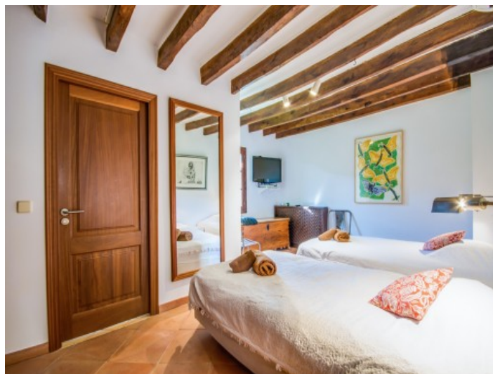
Dormitorio doble con baño en suite