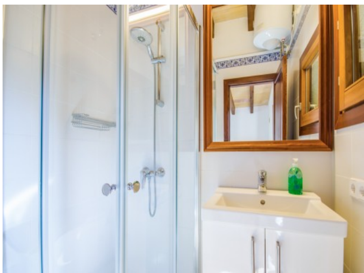
Baño con ducha