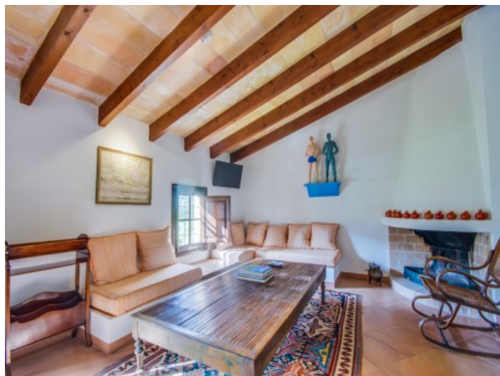
Dormitorio principal con zona de estar