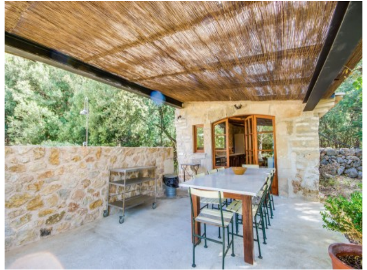
Terraza de la cocina exterior