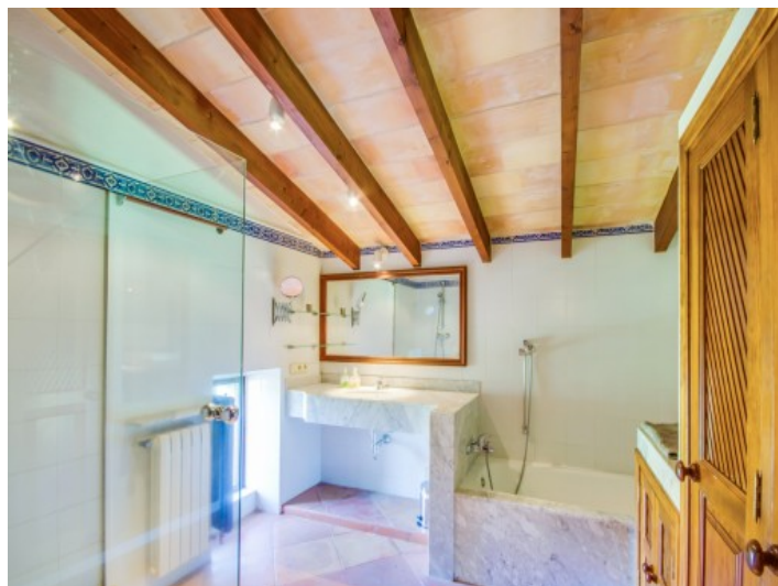
Baño inundado por luz natural