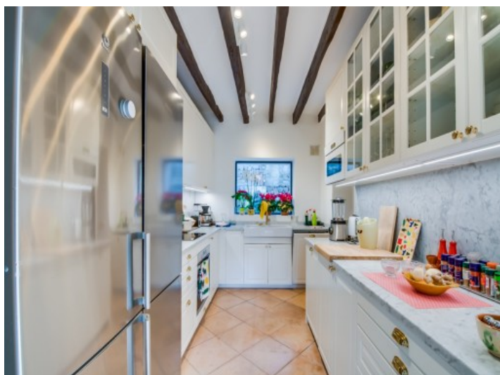
Cocina totalmente equipada