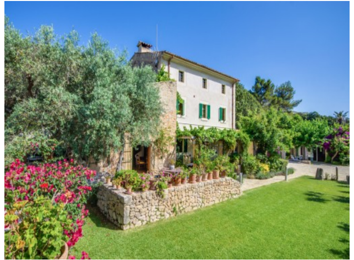
Vista exterior de la finca