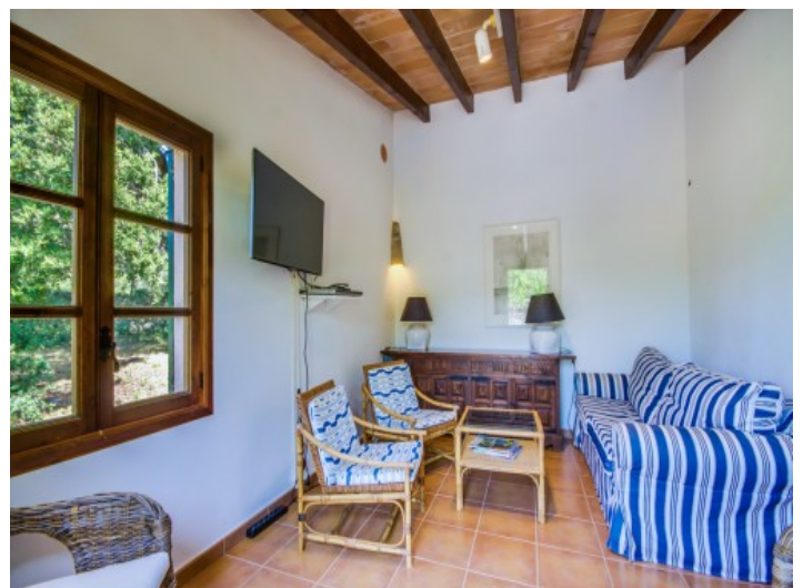
Zona de estar

Toda la información como mejor se puede saber, salvo por error durante el periodo de venta. Sirva este documento como un informe previo, las bases legales solo serán válidas a través de un contrato de compra acordado ante Notario.