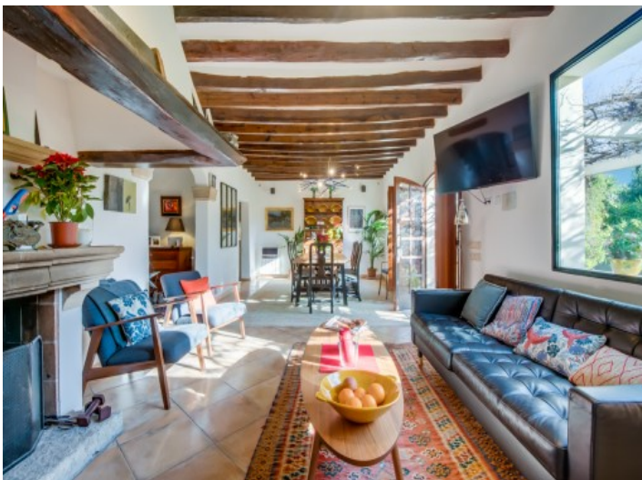
Salón inundado por luz natural