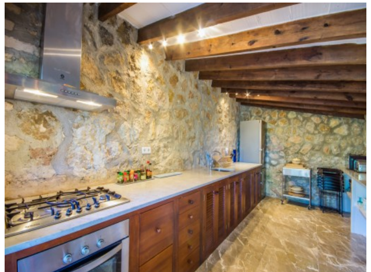
Cocina rústica exterior