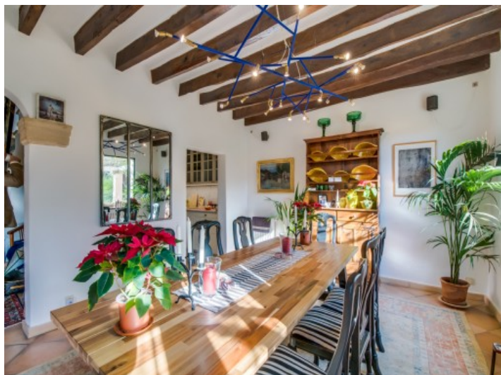
Comedor de la finca