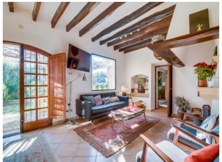
Salón inundado por luz natural

Toda la información como mejor se puede saber, salvo por error durante el periodo de venta. Sirva este documento como un informe previo, las bases legales solo serán válidas a través de un contrato de compra acordado ante Notario.