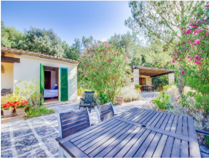
Vista a la casa de huéspedes y a la cocina exterior