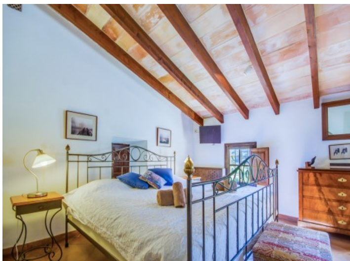
Dormitorio principal con zona de estar