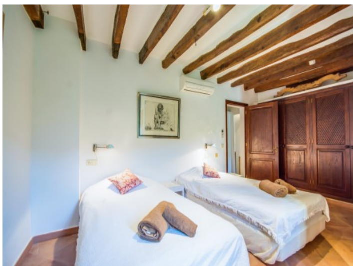
Dormitorio doble con baño en suite