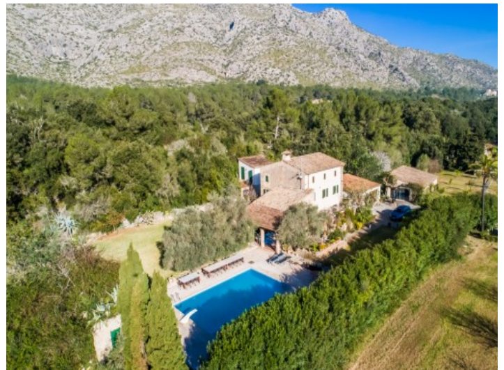
Vista exterior de la propiedad